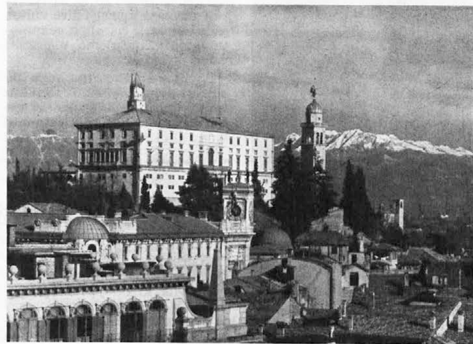
Na sliki vidimo Videm s svojim znamenitim zgodovinskim gradom, mesto, kjer so se pogajali zastopniki tromejnih dežel Furlanije, Slovenije in Koroške za izboljšanje gospodarskih in turističnih medsebojnih odnosov teh treh dežel.

Izvršni odbor glavnega odbora SZDL Slovenije je pozitivno ocenil razvoj obmejnega sodelovanja Slovenije in sosednih dežel Furlanije-Julijske v Avstriji in Italiji ter Koroške v Avstriji ter z obmejnimi področji Madžarske. Velik prispevek k razvoju teh odnosov dajejo narodne manjšine teh dežel. Izvršni odbor je s tem v zvezi ugotovil, da mora naša družba še nadalje poglobljati enakopravnost narodnih manjšin, dosledno izvajati sistem dvojezičnosti v Sloveniji ter pospe-