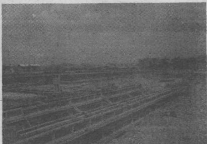
Od temeljnega kamna do temeljev za ves vrtec ob Cerutovi cesti je več kot korak.

V Zalogu so že tudi začeli akcijo čiščenja okolja, ki bo trajala do konca maja. Pred praznikom KS pa bodo akcijo znova organizirali. Lastnike najbolj urejenih objektov in stanovanjskih hiš bodo nagradili. KS in bronasta priznanja OF, ZRVS terena Zalog pa namerava ob tej namen, je zelo veliko. T. ŽIDAN