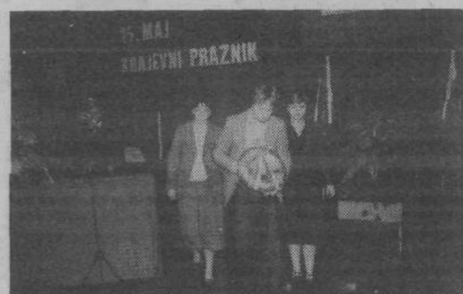
Krajani Most so se 15. maja množično zbrali v dvorani telovadnega društva Partizan in s krajšim kulturnim programom ter s podelitvijo priznanj zaslužnim krajanom počastili praznik svoje krajevne skupnosti. Ob tej priliki so tudi položili venec pred spominsko ploščo na stavbi krajevne skupnosti ob Zaloški cesti. (Na sliki: delegacija krajanov nese venec)