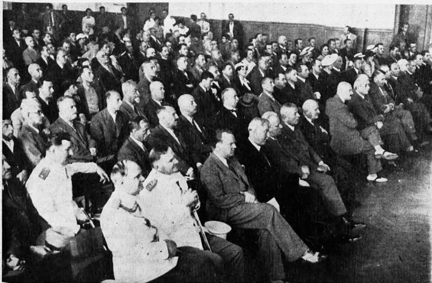
Pretstavnici vlasti, korporacija i udruženja i skupštinski delegati

U tome času skupština je priredila dugotrajne spontane burne ovacije Nj. Vel. Kralju i Kraljevskom Domu.