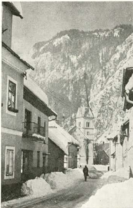
Pa je Črno le zametlo.