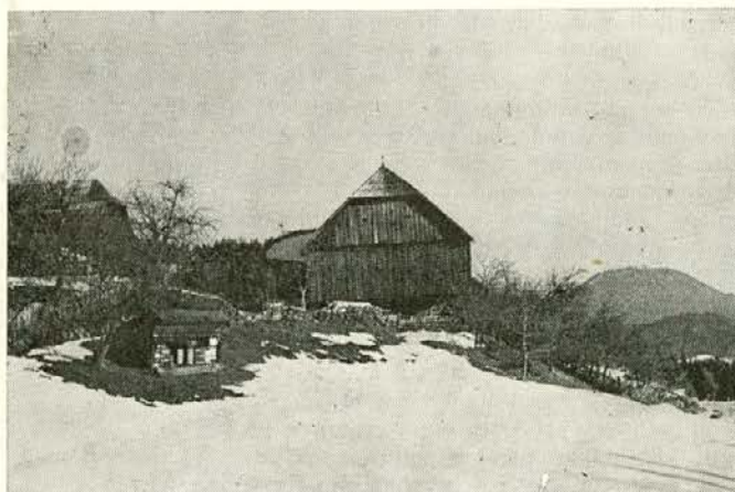
Na Ludranskem vrhu

Po prvotnem sanacijsko-investicijskem programu smo predvidevali predračunsko vrednost v višini 50,258.000 din. Celotna vrednost investicije v TOZD TP Prevalje (osnovna in obratna sredstva z vsemi dajatvami in predračunskimi podražitvami) znaša 114,387.000 din. Rezultati so se v TOZD TP Prevalje po investiciji zastrukturo izdelkov izboljšali od prvotnega sanacijskega programa.