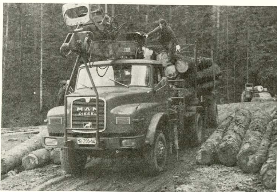
»Fura« je naložena