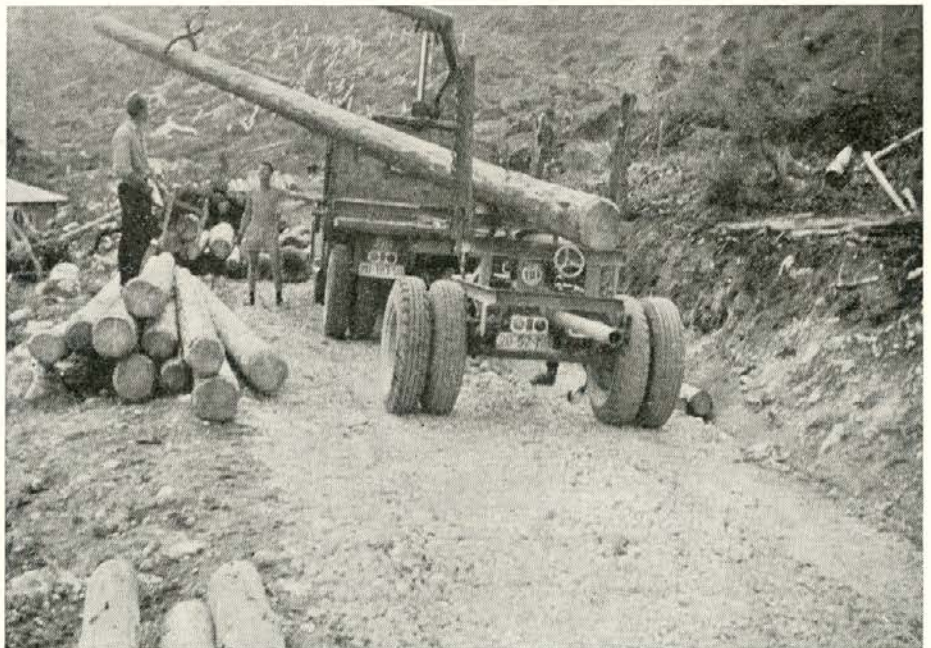
Olševa — tako smo nakladali les nekoč