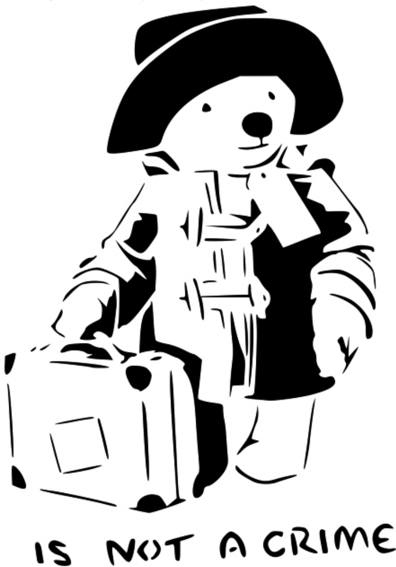
Slika 3: Selitev ni zločin