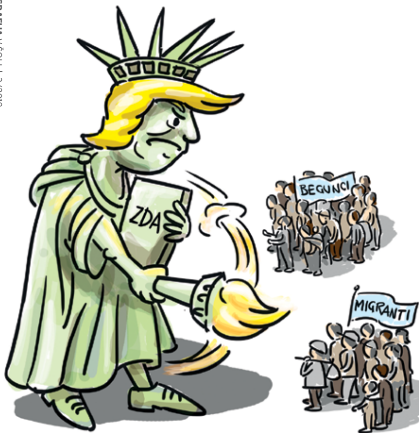
Slika 1: Strah pred begunci in migranti Karikatura: Davor Grgičević

Edina prava pot je integracija migrantov. O tem govori tudi dokument Ministrstva za notranje zadeve: Osnovo za politiko integracije tujcev v družbo so države članice Evropske unije postavile v okviru skupnih temeljev načel, ki poudarjajo, da je vključevanje dinamičen in dvosmeren proces. Za uspešno vključevanje priseljencev v družbo države gostiteljice je pomembno medsebojno prilagajanje.