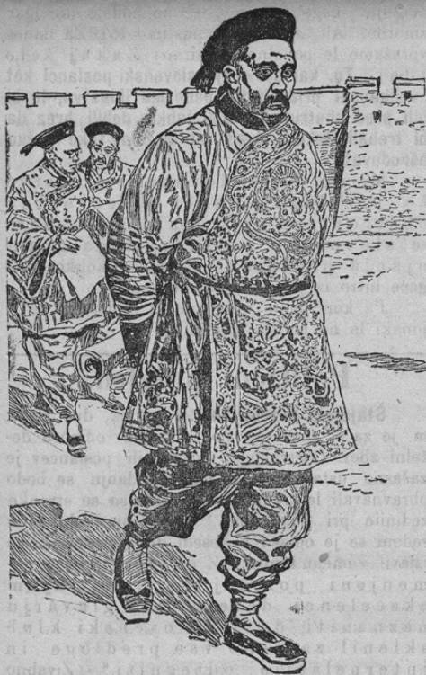
komandiral čete v boju proti japonce leta 1894. pozneje je postal guverner v Schantung. Volitev je dokazala, da je večina kitajskega ljudstva za njega in da je sedaj med vsemi državniki najiminentnejši.

Naša podoba nam kaže predsednika nove kitajske republike, Janschikaa. Novi prezident ima zanimljivo življenje za seboj. Bil je svoj čas ministerski prezident v Koreji,