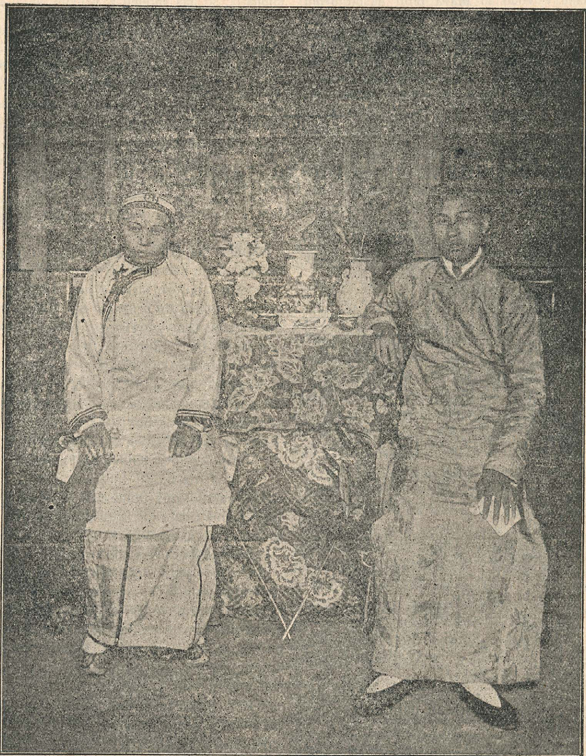
Kitajska: ženin in nevesta.

— Kako smo se oddahnili! Hitro vzamem par nogavic in čevlje ter hitim v Pet — Moun. Po poti mi