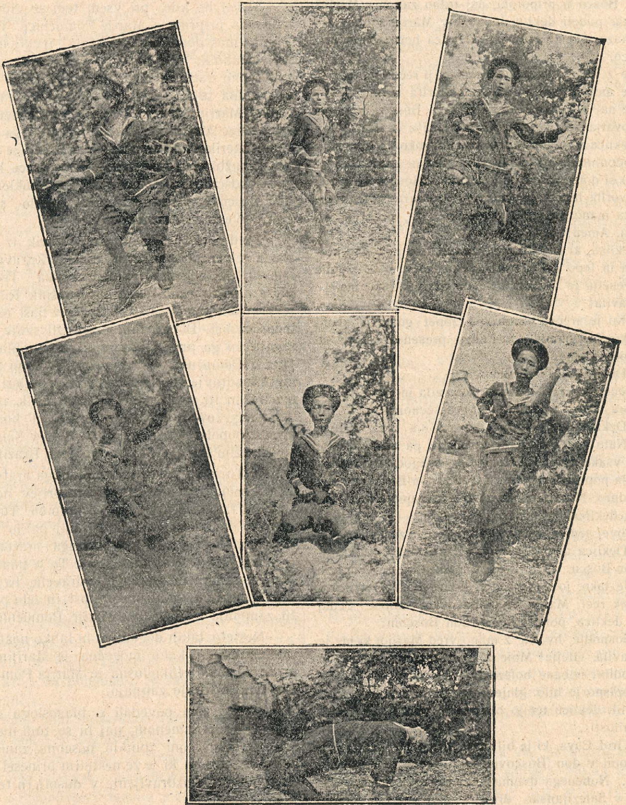
Telovadne vaje Kitajcev.