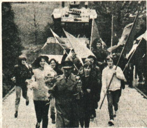
Štafeto mladosti smo letos na Vrhniki na več krajih počastili s kratkimi prireditvami v osnovni šoli in v vojašnici Ivan Cankar, kjer se je ustavila tudi pri spomeniku tankistom.