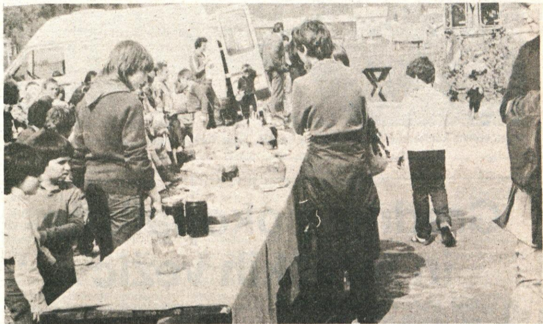
Bogat kulturni program in vrsta nastopajočih je popoldan na »Veselem dnevu« razvedril številne občane.

našega gospodarstva. Vendar nas to ne sme uspavati, da ne bi še bolj intenzivno delali na področju podružbljanja varnosti in družbene samozaščite kakor tudi na področju razvijanja in utrjevanja samoupravnih odnosov, kajti čim bolj bodo razviti samoupravni odnosi, trdnjši bo naš varnostni položaj.