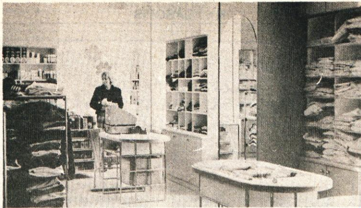
Pred kratkim je Mercator odprl obnovljeno Blagovnico na Vrhniki. Ne samo sodobno urejeni prostor, ampak tudi dobra založenost, je odlika te trgovine.

Ze ti skopi podatki jasno kažejo, da za vzdrževanje regionalne in lokalnih cest trenutno ni na voljo finančnih sredstev niti za najnujnejša spomladanska popravila asfaltnih in makadamskih cest ter za zamenjavo cestno-prometne signalizacije.