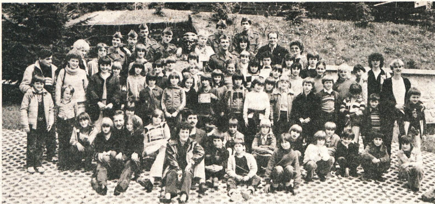
Otroški pevski zbor in sekciji za ritmično gimnastiko in moderni ples doma JLA so za dan mladosti obiskali karavlo, ki nosi ime po tovarišu Titu in se vojakom predstavila s svojim programom.