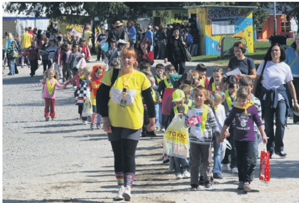
Pikin festival vsako leto obiše okoli 80 tisoč obiskovalcev, med drugim Piko obiše tudi več kot 150 šol in vrtcev iz vse Slovenije.

Velenje bo v nedeljo ponovno za en teden prevzela Pika Nogavička. Pikin festival, ki je največja slovenska otroška prireditev, bo letos še obširnejši in evropsko obarvan.