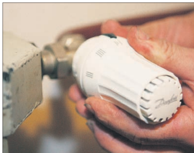
Tam, kjer jih še niso imeli, so na radiatorje namestili tudi termostatske ventile.

Po naših izkušnjah je najbolj pomembna predstavitev prehoda na drugačen način obračunavanja stroška ogrevanja, saj so stanovalci bili navajeni delitve po ogrevalni kvadraturi. Pri novem sistemu se morajo zavedati, da prihaja in bo prihajalo do različnih porab med uporabniki zaradi različnih navad (temperatura v stanovanju, zračenje, skrb za zatesnjenost oken ...) in prejšnjih naložb v sistem ogrevanja ter zmanjšanja toplotnih izgub (hidravlično uravnoteženje sistema, izolacije podstrešij in skupnih prostorov v kletih, izolacije fasad, termostatski ventili na radiatorjih ...). Opažamo, da se lahko največ prihrani v prehodnih obdobjih. Ne svetujemo pa, da se stanovanja podhlajajo, torej prevelikega varčevanja, saj lahko prihaja do kondenzacije vlage v stenah in posledičnega pojavnosti plesni.«