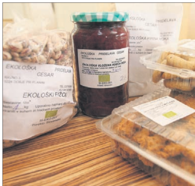
Domači izdelki z ekološkim certifikatom