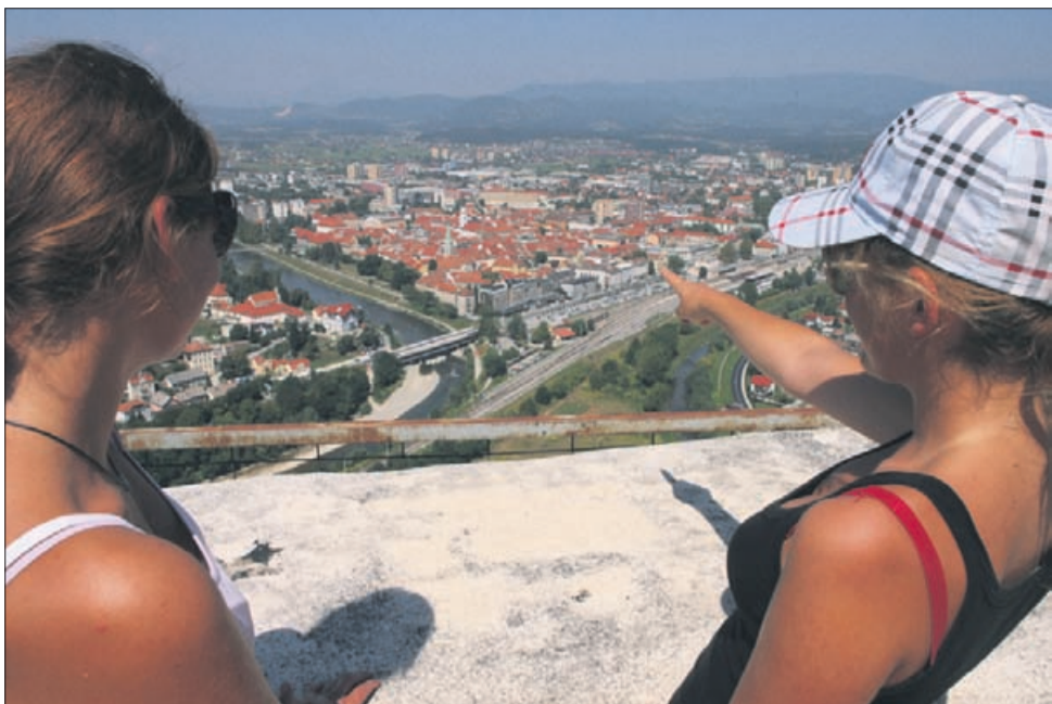
Letos je na kurilno sezono treba misliti že v času, ko nam je še vroče.