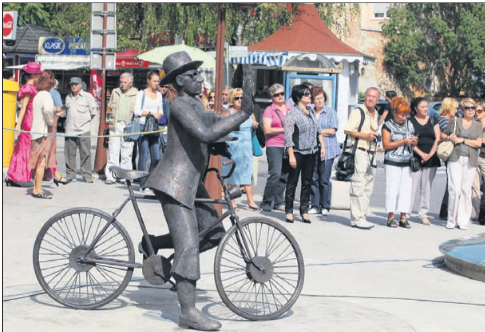
Ob otvoritvi kipa Josipa Pelikana na Trgu celjskih knezov