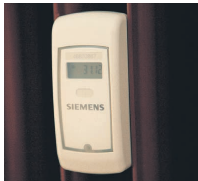
Delilnik porabe mora biti nameščen na vsakem radiatorju.