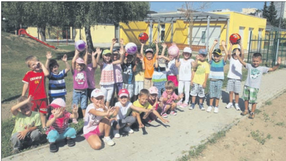
Mestna občina Velenje je tudi z izgradnjo nizko energetskega vrtca Vrtiljak I omogočila prosto mesto v vrtcu za vse vpisane otroke.