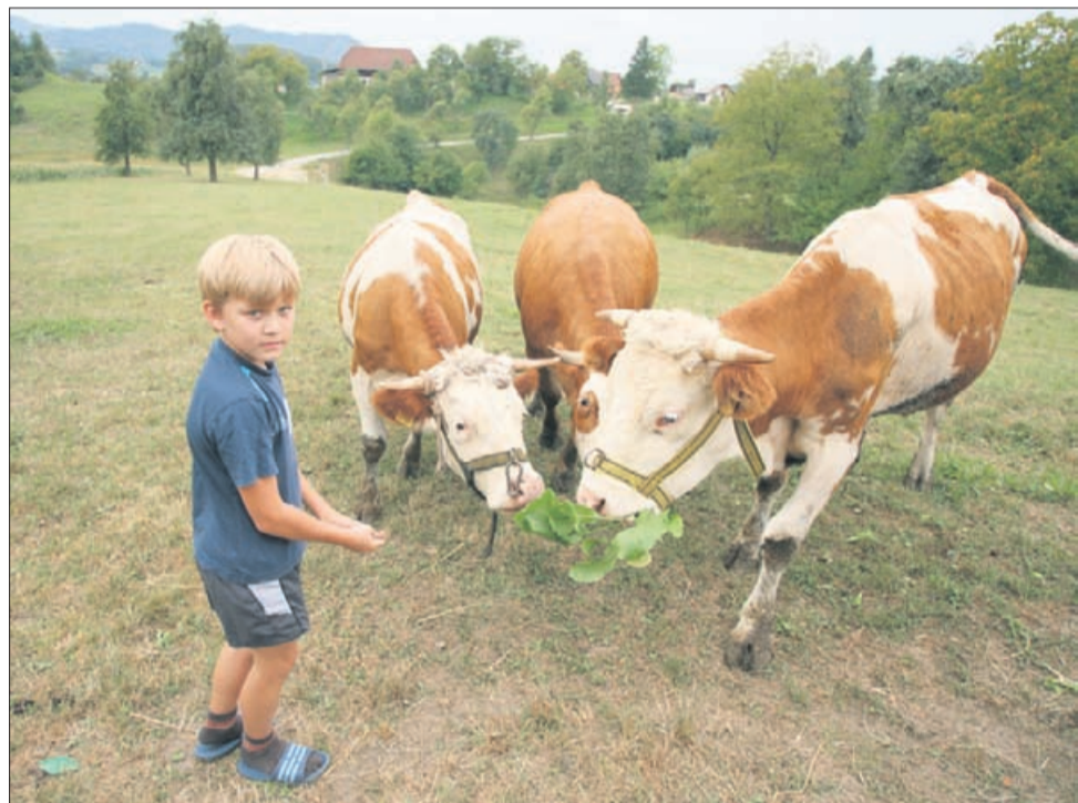
Pri Cesarjevih pasejo kakšnih osem goved, prašiče imajo samo za domače kolone.

ča pa se zgolj zaradi lastne zavesti, da je tako dobro in prav, ter zaradi ljudi, ki to znajo ceniti. Meso enega ali dveh goved na leto prodajo na domu. Cena v klavnici je namreč zgolj deset centov boljša kot za običajno vzreje-