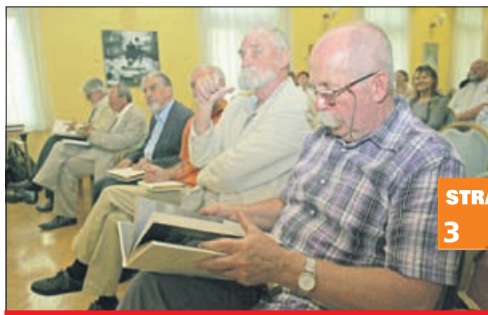
Po Almi še Pelikan