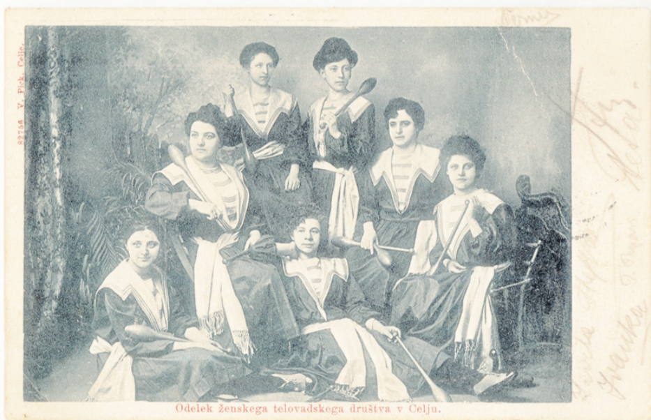
Odelek ženskega telovadskega društva v Celju.