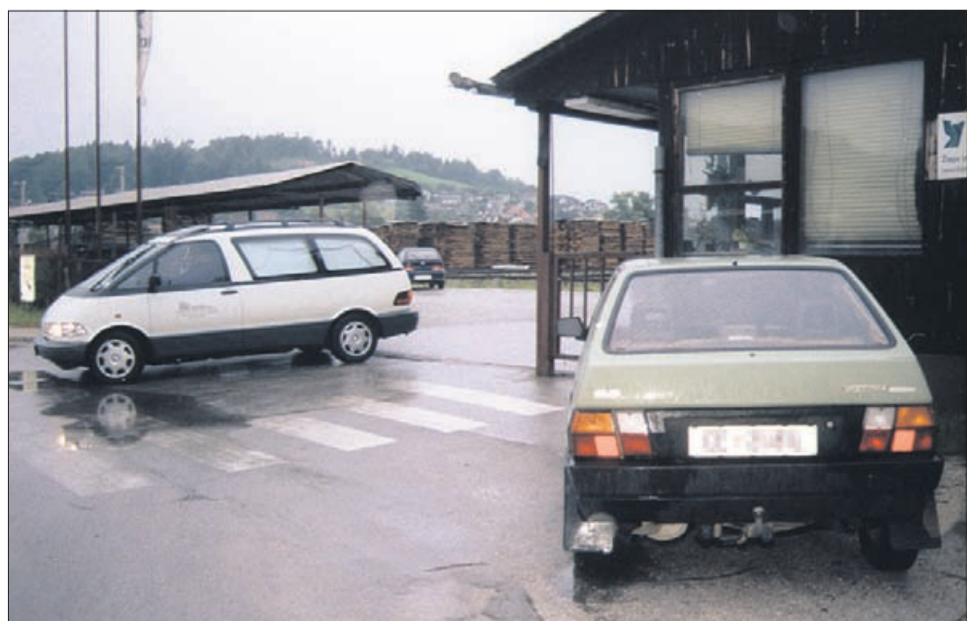
Takole so usodnega 6. junija 2001 iz Bohorja odpeljali truplo nesrečne ženske.