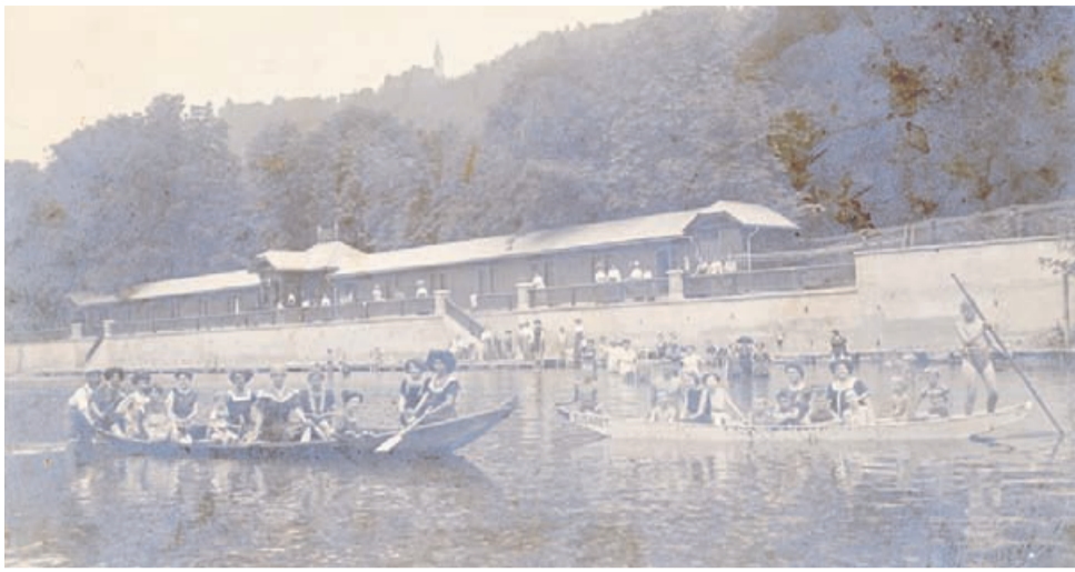
Poletno veselje na Savinji, Celje, pred 1914.