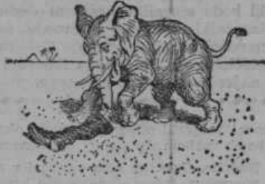
Mlad slon škorenj je dobil. Kdo tega bi vesel ne bil?