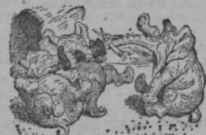
O joj — strašno ga zaboli in zob več svojih videl ni.