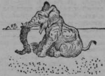
Obutev ta za nogo ni, da le na rilcu mu tiči.