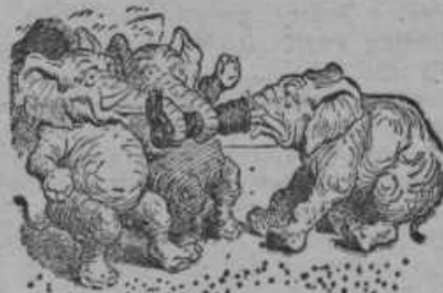
Brž starša povlečeta, da ta nestvor mu slečeta.