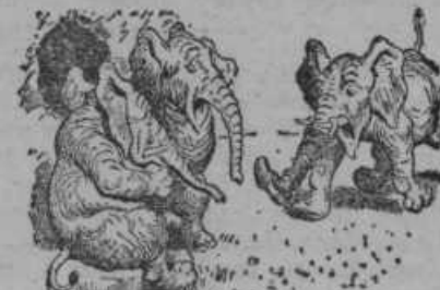
A zlobka, kdo sezuje to? Domov letel je z vso skrbjo.