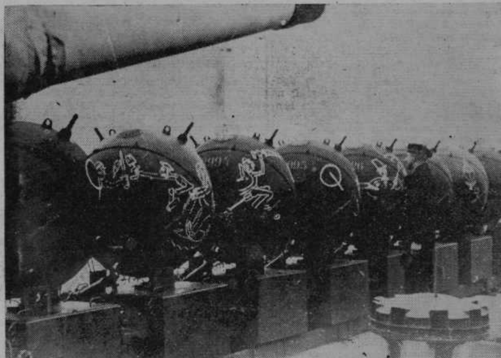
Nemški minonosiec na poti k polaganju min. da z njimi zapre morski prostor pred vdorom sovražnih ladij. Mornarji si krajšajo na vožnji čas s tem, da slikajo na mine zabavne slike.

Še enkrat — 23 let pozneje — je odmevalo od gibraltarskih skal bobnenje topov. Tokrat