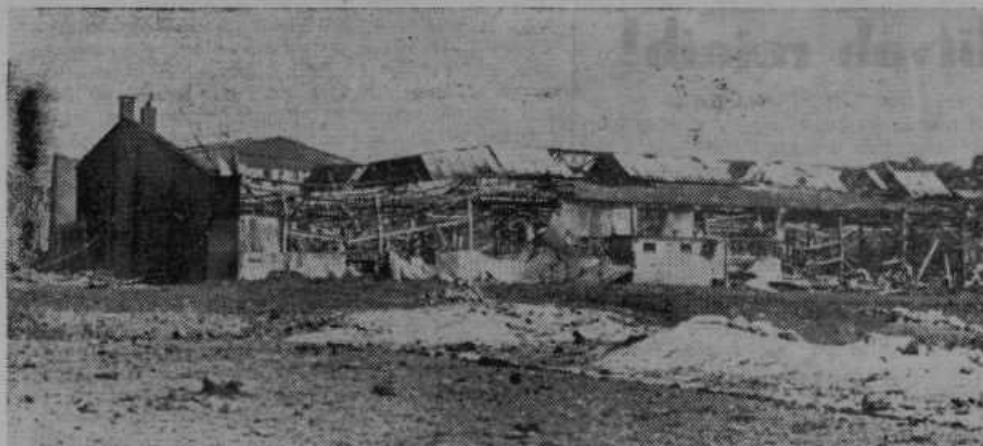
Slika nam predstavlja neko letališče na zapadu, katerega so obmetavala sovražna letala in ga popolnoma uničila s shranjenimi letali vred.