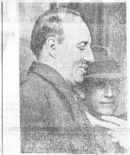
Belgijski predsednik vlade Van Zeeland, ki bo po informacijah v najkrajšem času posejil Berlin, Prago in Dunaj.

Pravico starta imajo vsi dirkači, ki posedujejo pravilno izdano legitimacijo Kolesarskega saveza kralj. Jugoslavije za l. 1937. Vsak dirkač vozi na lastno odgovornost ter se mora strogo držati predpisov U. O. I., ki so določeni za dirke na dirkališčih. Posebno se opozarjajo dirkači na določila, da morajo biti kole-