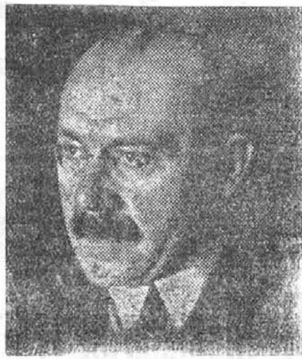
Predsednik češkoslovaške vlade dr. Hodža,

PRAGA, 17. julija. Zdi se, da nima kri- za dr. Hodževe vlade svojih vzrokov samo v nesoglasju radi vprašanja žitnih cen, marveč da temelji tudi na političnih momentih. Socialisti kažejo namreč, da niso nič kaj pripravljeni, da spričo sko- rajšnjih novih volitev pristanejo na zvi- šanje krušnih cen. Radi tega se pričakuje imenovanje nove uradniške vlade in sko- rajšnji razpis novih volitev.