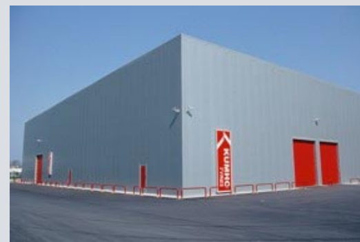
Paam auto d.o.o., ob Dravi 3/a 2251 Ptuj

Podrobnejše informacije dobite na tel. št.: 788 13 04, fax: 788 13 10