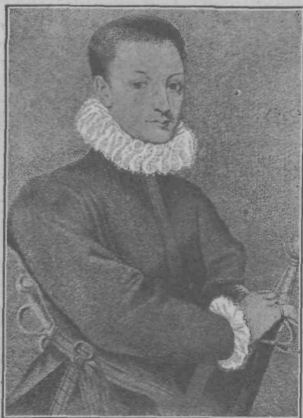
Sv. Alojzij, - zglede evharist. ljubezni.

Ko smo orisali že več vzornih nežnih prijateljev in prijateljic božjega Zveličarja, ki nas čaka v tabernaklju, ne smemo prezreti, da najdemo mikavnih zgledov tudi med mladino slovanske krvi. Poglejmo danes tja gori na Poljsko.