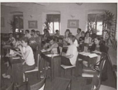
Predavalnica, kjer smo razglabljali o razstavah kot muzeološkem mediju.