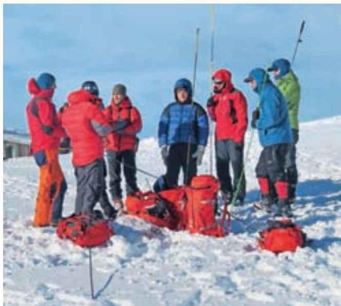
Na eni od delovnih točk