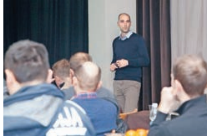
V javnih razpravah so občani izrazili željo po boljše urejeni infrastrukturi za pešce in kolesarje, varnejših šolskih poteh ter zmanjšanju tranzitnega prometa skozi Tuhinjsko dolino.

Aktivno so se v pripravo strategije vključili tudi mladi, ki v 60 odstotkih v šolo prihajajo z avtomobilom, 23 odstotkov jih uporablja javni prevoz, 17 odstotkov pa jih prikolesari ali pride peš. Z namenom izboljšanja prometne varnosti in spremembe potovalnih navad so se v