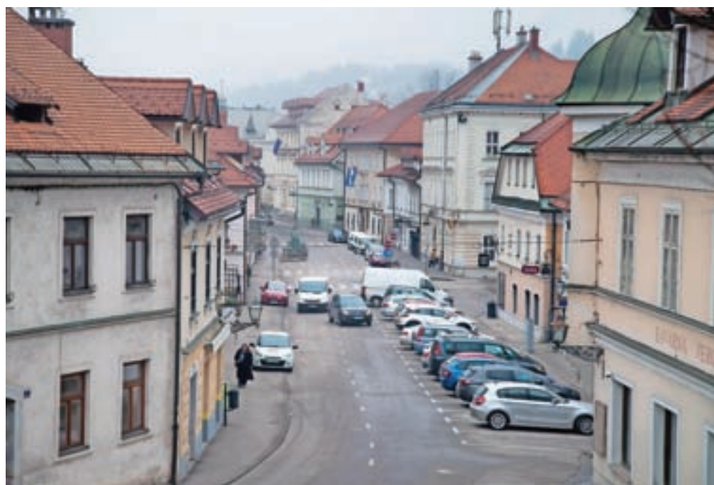
Kamnik bo spomladi dobil novo, trajnostno naravnano prometno strategijo, s katero naj bi bilo odprtih tudi več možnosti za kandidiranje za evropska sredstva.

V pripravi je celostna prometna strategija, k pripravili katere je občina pristopila v sodelovanju s predstavniki podjetja Locus, Ljubljanskega urbanističnega zavoda, Zavoda Štajn ter Centra za vodenje participativnih procesov. Sredi januarja je v Domu kulture Kamnik potekala zadnja, četrta javna razprava v sklopu izdelave Celostne prometne strategije za Občino Kamnik, ki se s tem preveša v sklepno fazo. Na občinski upravi računa-