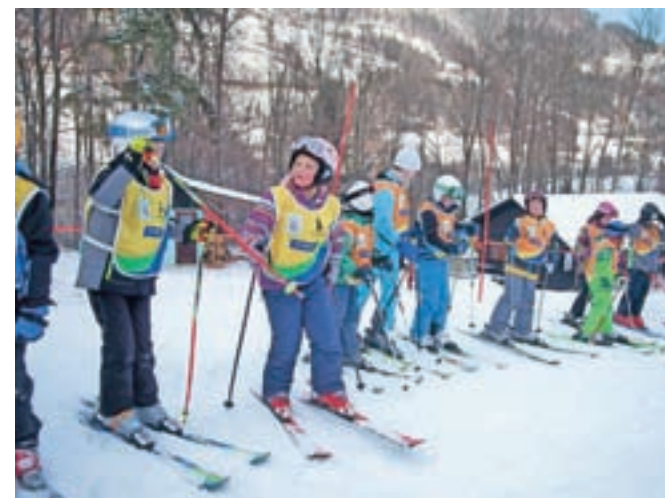
Med čakanjem na žičnico je vedno gneča ...