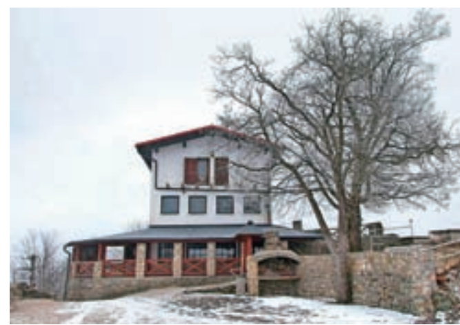
Stari grad naj bi kmalu dočkal lepše čase.

prostorih je sanirana vlaga (tlaki, stene) in obstoječ armiranobetonski strop v kuhinji. Hkrati so bile obnovljene zamašene odtočne kanalizacijske cevi ter strojne in elektro instalacijske cevi, ki so bile položene v tlake in 'cokel' sten z namenom, da se izognemo nepotrebnim podvajanjem stroškov in naknadnim rušitvenim delom,« odgovarja Žavbi. Letos se bodo gradbena dela nadaljevala v spodnjih prostorih. Uredili bodo točilnico, sanitarije in garderobe. Izvedli bodo tudi hidroizolacijo skladišča, uredili pa bodo tudi zunanji zid po celotni dolžini severne strani objekta. Uredili bodo dimniško tuljavo centralne peči, odstranili obstoječo greznico in vgradili malo čistilno napravo, postavili bodo tudi podstavek za plinohram. »Za našta dela je bil po re-balansu proračuna za leto 2016 v mesecu novembru na portalu javnih naročil objavljen razpis za obnovo kleti na Starem gradu. Do roka za oddajo ponudb so na naslov