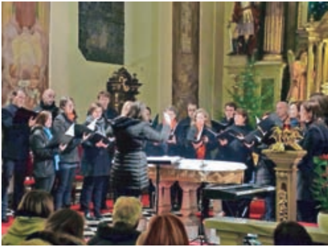
MePZ Cantemus

Mešani pevski zbor Cantemus je leto zaključil z božičnim koncertom v kamniški cerkvi Sv. Jakoba.