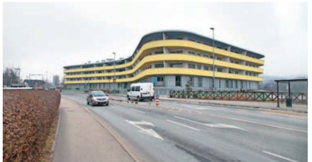
Optično omrežje je v Kamniku na voljo tudi v stanovanjskem objektu Metuljček na Bakovniku, kjer trenutno poteka tudi njegova posodobitev.

Kamnik – Število uporabnikov interneta v Sloveniji vsekozi raste. Lani ga je po podatkih Statističnega urada uporabljalo 76 odstotkov prebivalcev, starih med 16 in 75 let, mlajši večinoma prek mobilnega telefona. Približno 78 odstotkov gospodinjstev je imelo dostop do interneta, od tega pa je le 29 odstotkov do svetovnega spleta dostopalo preko optičnega omrežja. Telekom Slovenije za zdaj v kamniški občini optično omrežje nudi zgolj na področju Perovega, Vranje Peči, Volčjega Potoka in stanovanjskega naselja Metuljček na Bakovniku, kjer trenutno poteka tudi posodobitev optičnega omrežja. Na vseh ostalih področjih gospodinjstva do svetovnega spleta dostopajo preko drugih povezav. Kot pojasnjujejo na Občini Kamnik, ki sicer ni pristojna za gradnjo telekomunikacijskega omrežja, je občini vsekakor v interesu, da bi bila naselja pokrita z internetom, zato ob gradnji cest, kanalizacije in vodovodov pozivajo operaterje, da sočasno zgradijo svoje optično omrežje.