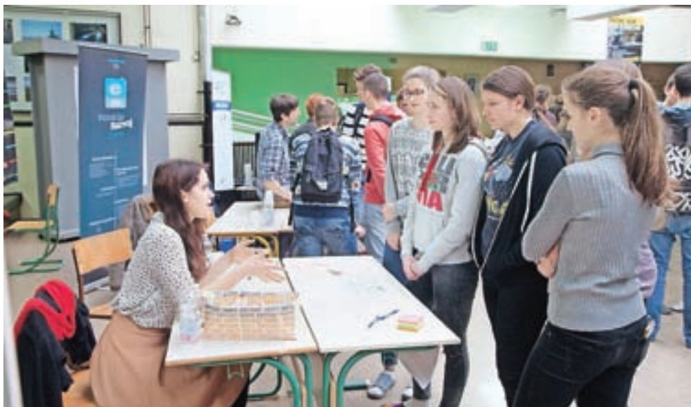
Na tretjem kariernem dnevu se je dijakom predstavilo največ podjetij do zdaj.

Karierna tržnica je v sredo dopoldne potekala v šolski avli. Na njej se je predstavilo 14 podjetij in ustanov, ki prihajajo iz različnih področij delovanja, saj kot je povedala Vrhovčeva, želijo privabiti širok spekter podjetij in se ne omejujejo zgolj na tista, ki so najožje povezana s šolskimi vsebinami kamniške srednje šole. Tako so se med drugimi predstavili Električna/Interblok, Danfoss Trata, Titan dom, Terme Sno-