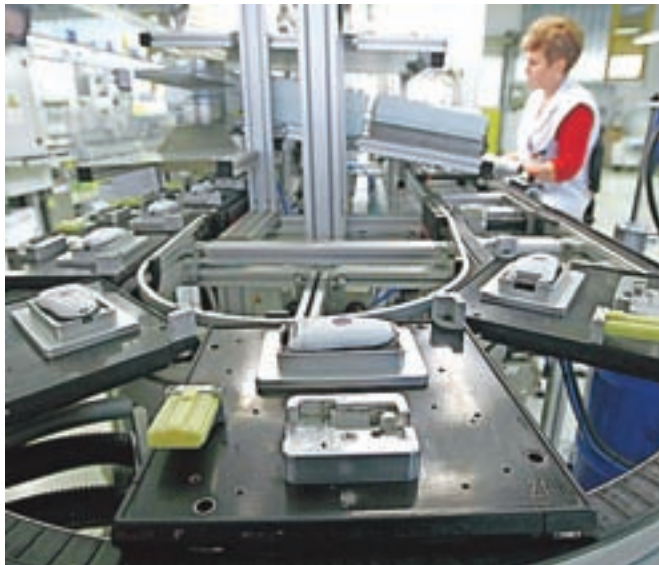
Depilatorje v podjetju proizvajajo že dlje časa, letos oz. lani pa so začeli proizvodnjo svetlobnih depilatorjev nove tehnologije.

Sklenjen posel pa je od podjetja zahteval precejšnjo prestrukturiranje. Philips je namreč lani večino proizvodnih linij za izdelavo klasičnih depilatorjev preselil na Kitajsko, izdelava novih pa zahteva popolnoma nov način proizvodnje. »Nov nivo proizvodnje zahteva t. i. čisto sobo, v kateri teče proizvodnja, zelo zahtevno je obvladovanje proizvodnje, saj mora biti izdelek ne samo stodostno zanesljiv in varen, ampak morajo biti tudi sama proizvodnja in posamezni materiali in sestavni deli sledeni, tako da se lahko nadzira in ukrepa v primeru