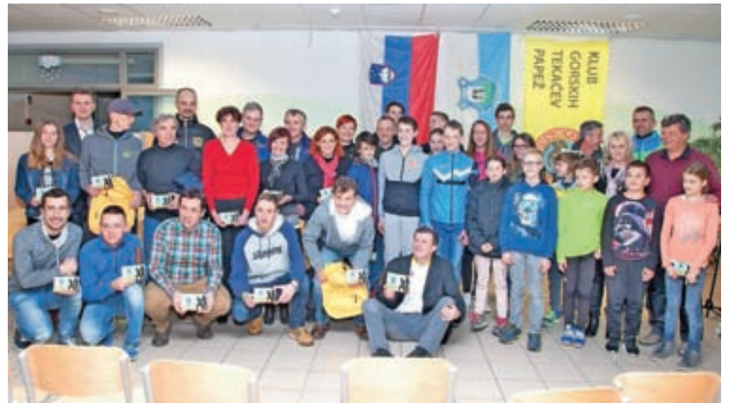
Najboljši tekači in organizatorji letošnjih tekem za Tekaaški pokal Občine Kamnik