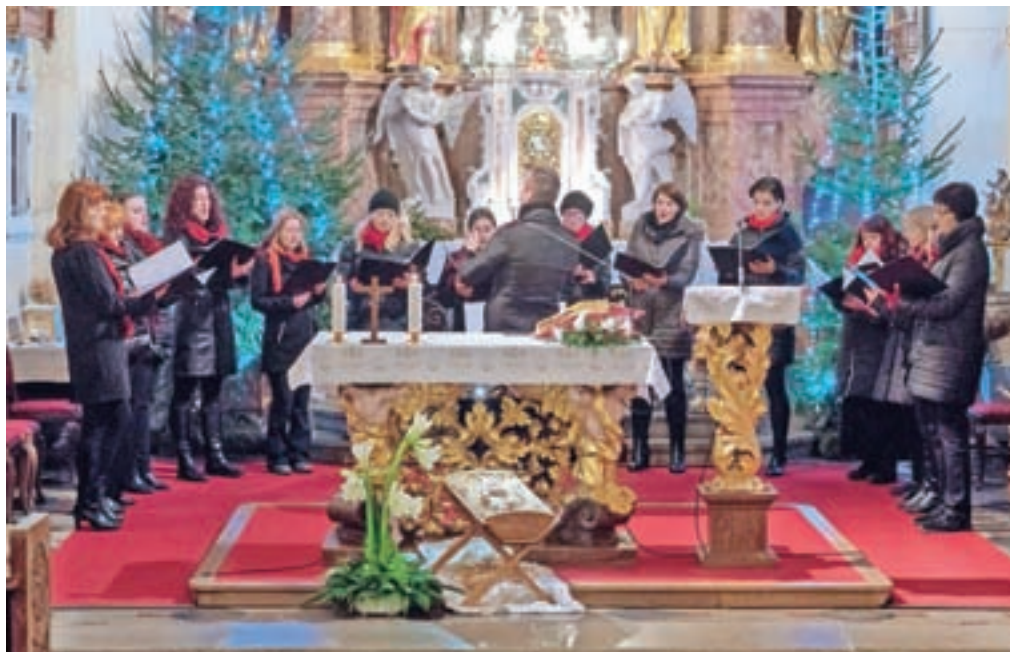
Pevke ženskega komornega zbora Vox Annae so znova pripravile sklop božičnih koncertov.