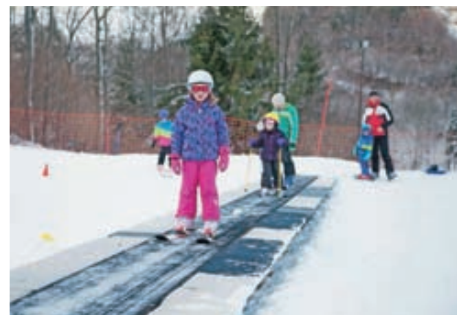
Letošnja pridobitev je tekoči trak, s katerim je smučišče v Osovju družinam še bolj prijazno.