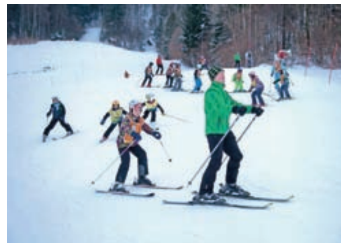
Domači učitelji smučanja bodo tudi med letošnjimi zimskimi počitnicami organizirali odlično obiskane tečaje.