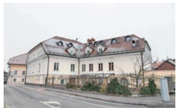
Po petih neuspešnih javnih dražbah je stečajni upravitelj predlagal odstop hotela Malograjski dvor hipotekarnemu upniku, banki Sberbank.

od nakupa odstopil. Kot je takrat povedal Novak, so v času obnovitvenih del, za katere so vedeli že pred nakupom in jih prevzeli v svoje breme, ugotovili še druge napake, zato so odstopili od nakupa. Novak je takrat opozoril, da je bil celoten računalniški sistem, preko katerega je bil voden sistem celotnega upravljanja hotela, od recepcije, blagajniškega poslovanja, kartičnega zaklepanja sob do regulacije sistemov ogrevanja, hlajenja in prezračevanja hotela, nedelujoč. Prav tako ni deloval sistem ogrevanja in centralna klimatska naprava, ob močnejših nalivih pa je prišlo tudi do vdora vode v kletne prostore preko tal in zidov. »Objekt vzdržujemo in ga skozi celo kurilno sezono tudi ogrevamo, tako da je v