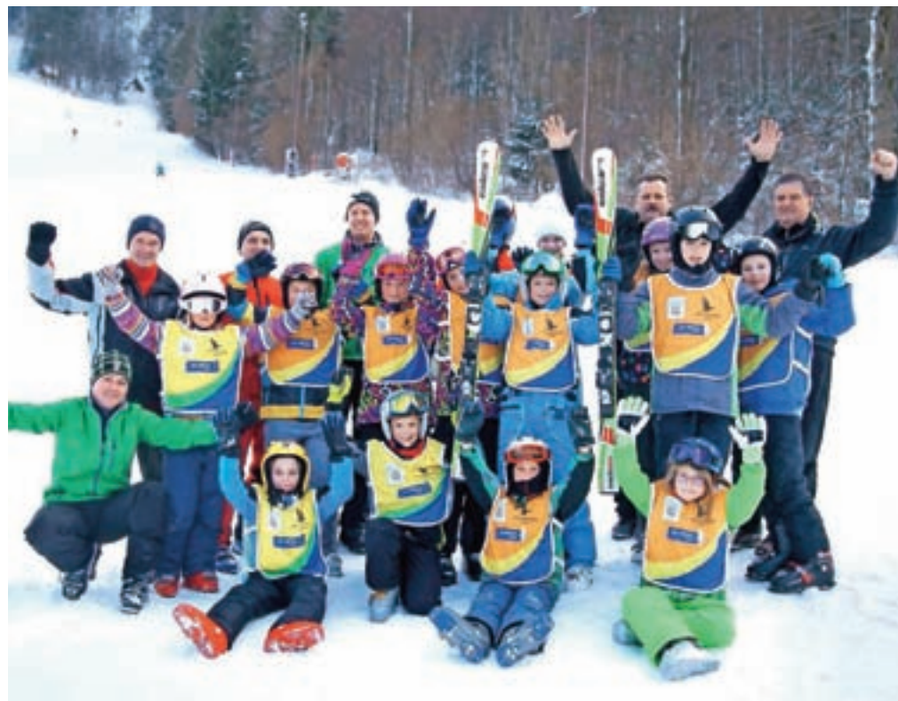
Člani Smučarskega društva Črna dajejo velik poudarek delu z mladimi.