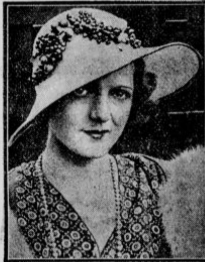
Pomladanska moda. Na pomladanskih klobukih ne bodo ženske nosile cvetja kakor doslej, temveč črešnje, jagode in slično kot okras.

Italijanska vlada je sklenila zgraditi železnico na najvišji vrh v Italiji na Gran Sasso d' Italia. Mussolini se je zelo pohvalno izrazil o načrtu, ki bo doprinesel, da naredi pristopnim to slikovito pokrajino, ki se nahaja blizu Rima. Stroške za železnico v Abruce bodo krili država, neapelske banke in okoliške občine.