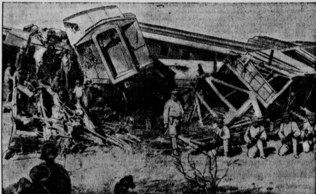
Razbojniki napadli vlak. Razmere v Meksiki so še zelo nesigurne. Pred nedavnim časom so napadli ekspresni vlak, ki vozi iz Meksike v Združene države. Razbojniki so se nadejali dobiti bogat plen, a so bili preganjeni od vojaških čet, ki so spremljale vlak.

Po poročilih »International New-Service« iz Moskve je radi silnega pomanjkanja živila prišlo v Sovjetski Rusiji do težkih izgredov in ropov. Ko so pred dnevi v Moskvi objavili, da bo prehranjevalni urad izdajal maslo, se je pred uradom zbrala velika množica žena. Ko so pričeli na posebne izkaznice deliti maslo, ki ga niso dobili že meseca, in zahtevali za kilogram sedem rubljev, mesto 2 in pol kakor doslej, je množica žen napadla prodajalce in izropala trgovino. Na pomoč poklicane čete so razgnale s silo besneče žene. Mnogo je ranjenih in ubitih. Do sličnih izgredov je prišlo tudi po drugih mestih.