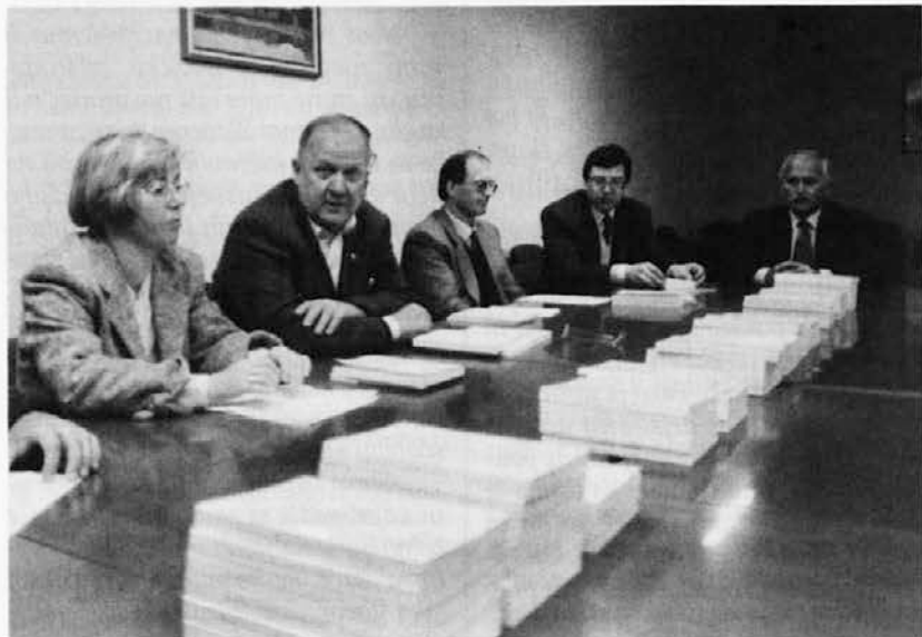
Knjige Krožka V. Šček so predstavili avtorji