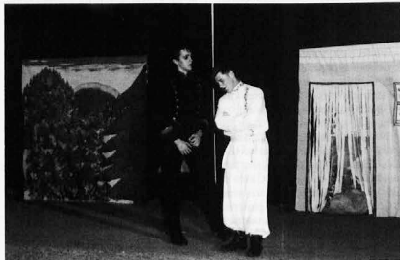
Prizor iz Martina Krpana