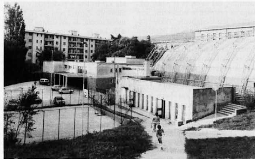
»Balon« slovenskega stadiona pri Sv. Ivanu