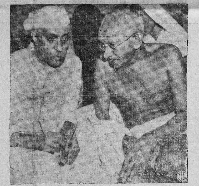
Indijska voditeljja. — Skoro gotovo, da sta moža, ki ju kaže gornja slika najpomembnejša v vsem indijskem kongresu. Levi na sliki je Rashtrapati Jawaharlal Nehru, novoizvoljeni predsednik indijskega kongresa in poleg njega pa je indijski politični prvak Mohandas K. Ghandi.