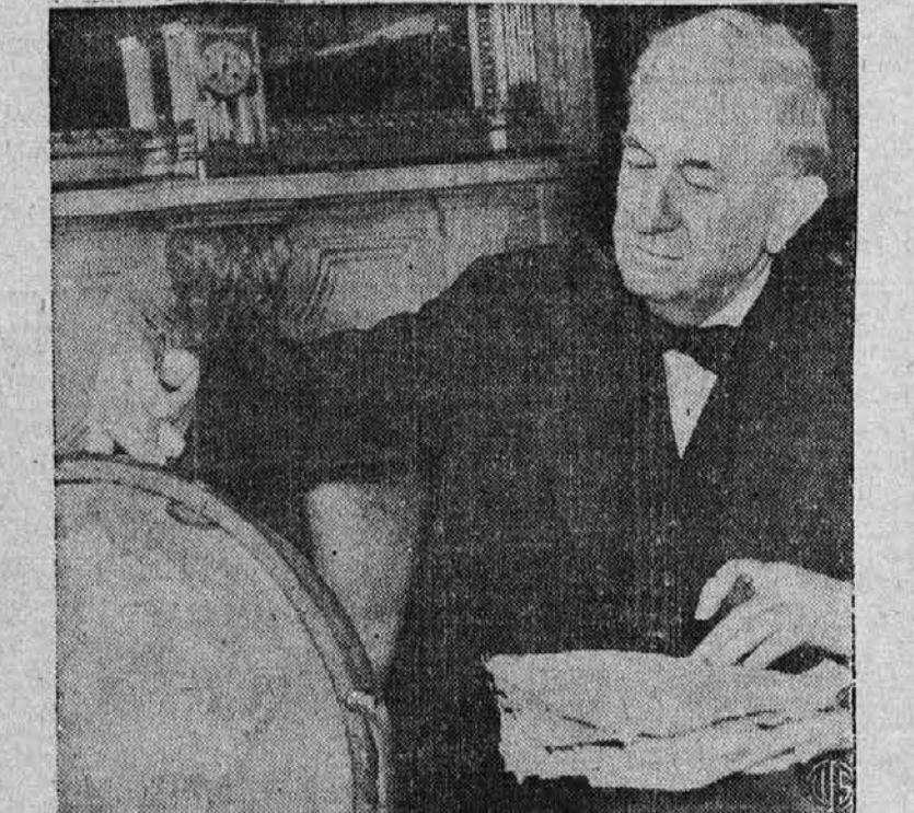
Senator Tom Connally, demokrat iz države Texas pri delu, ko pripravlja poročilo o nedavnem posetu Pariza, kjer se je udeležil tudi konferenca zunanjih ministrov velikih štirih. Slika nam ga kaže v njegovem uradu v Washingtonu. Je načelnik senatnega odbora za zunanje zadeve in je bil član ameriške delegacije na pariški konferenci.