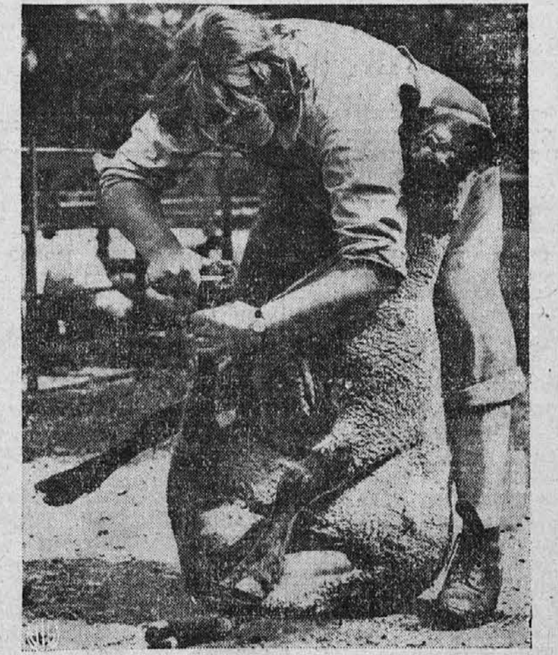
Da se prepreči bolezen na parkljih pri ovcah, jim je treba iste večkrat očistiti in porezati. Na sliki vidimo kmečko dekletko, ko porezuje parklje domači ovci in kot je videti je ovca prav zadovoljna s to operacijo.