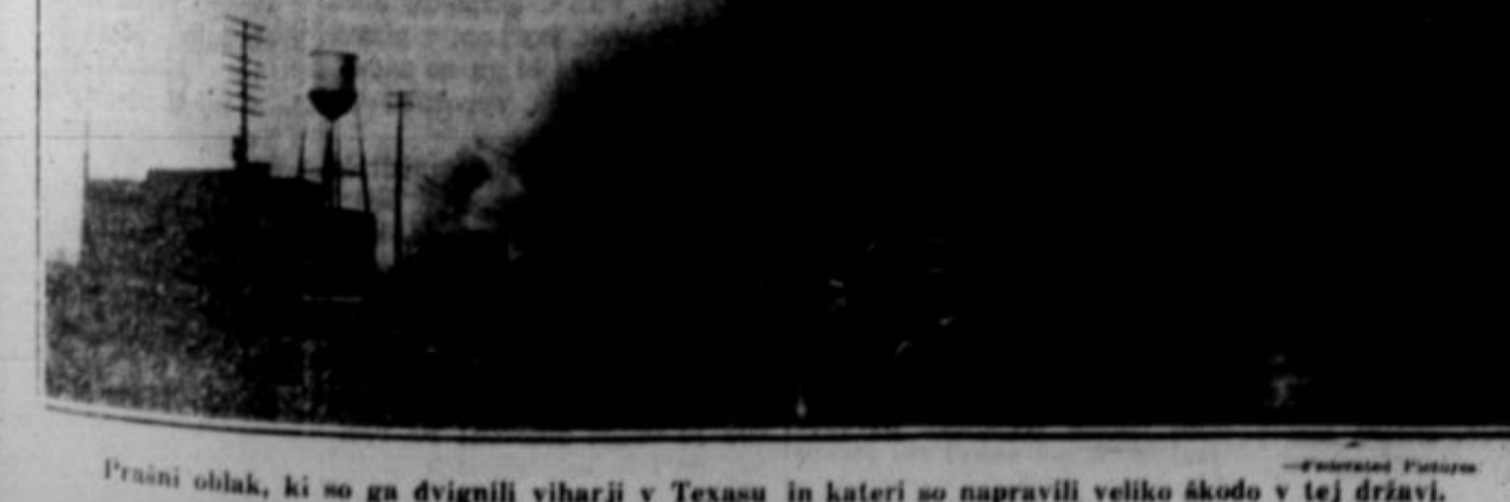
Pravni oblak, ki so ga dvignili viharji v Texasu in kateri so napravili veliko škodo v tej državi.