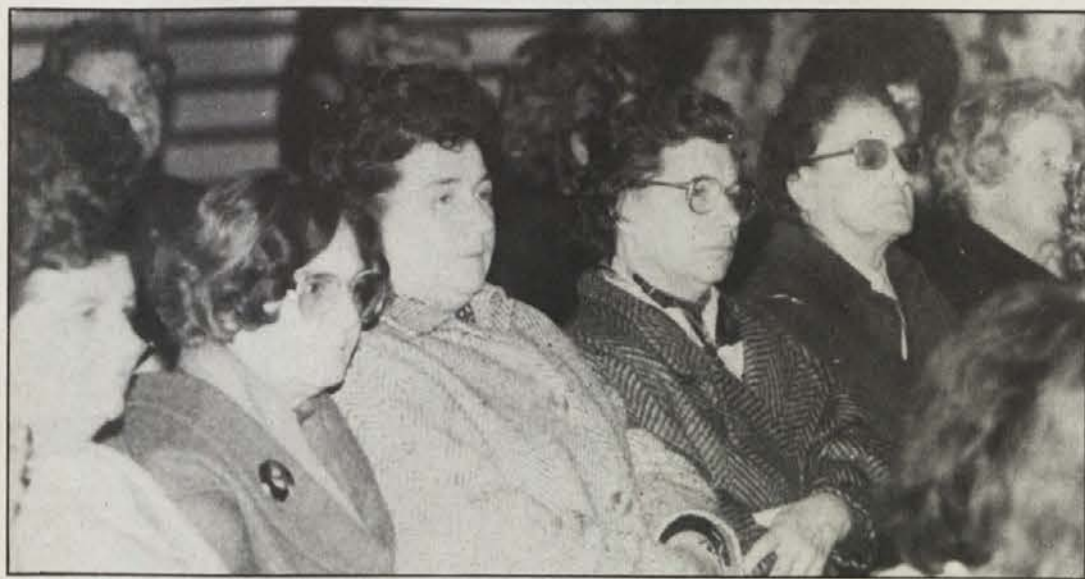
Na praznovanje dneva žena je prišlo veliko število žensk z vseh koncev južne Koroške.