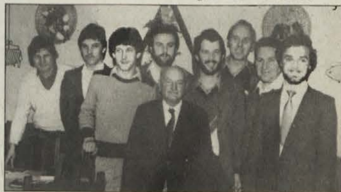
Prvi odbor MoPZ „Kralj Matjaž“

Izkupiček jubilejnega koncerta so Matjaževci namenili za izgradnjo kulturnega doma v Pliberku.