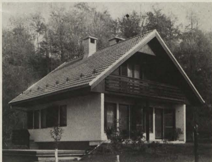
TIP MH S 2-40