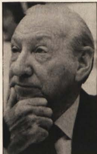
Po najnovejših anketah ga spet podpira večina; avstrijski predsednik dr. Kurt Waldheim.

Janez Stanovnik je v petek, 6. maja na seji vseh treh zborov slovenske skupščine v Ljubljani s slavnostno zaprisego prevzel funkcijo predsednika Predsedstva Socialistične republike Slovenije. Novemu predsedniku je brzojavno čestitala tudi ZSO.