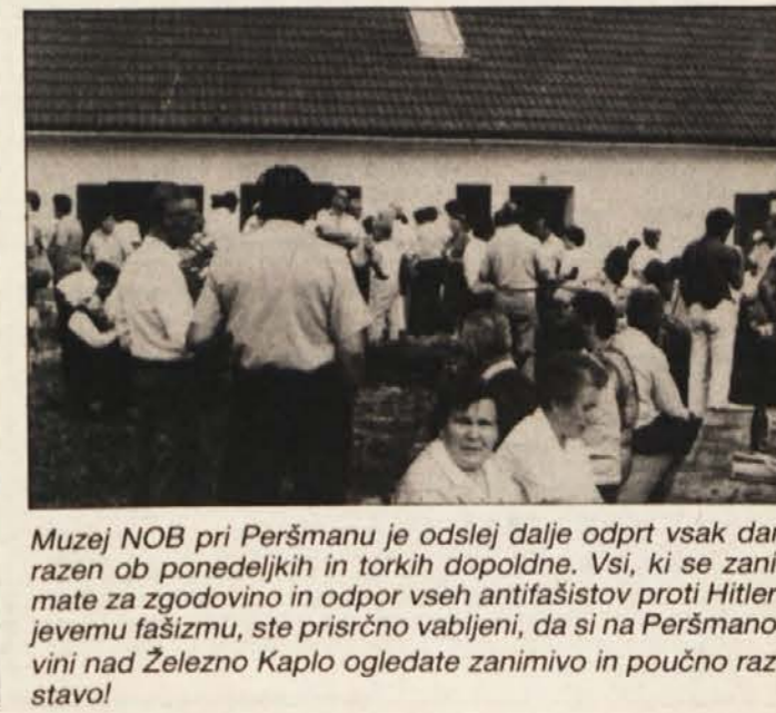
Muzej NOB pri Peršmanu je odslej dalje odprt vsak dan razen ob ponedeljkih in torkih dopoldne. Vsi, ki se zanimajo za zgodovino in odpor vseh antifašistov proti Hitlerjevemu fašizmu, ste prirčno vabljene, da si na Peršmanovini nad Železno Kaplo ogledate zanimivo in poučno razstavo!