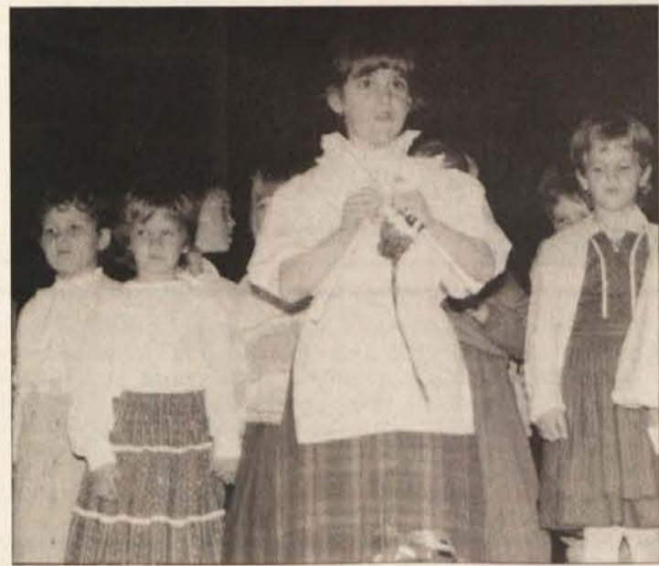
Nastopili so tudi otroci iz vrtca v Šentprimožu in otroški zbor SPD „Srce“.