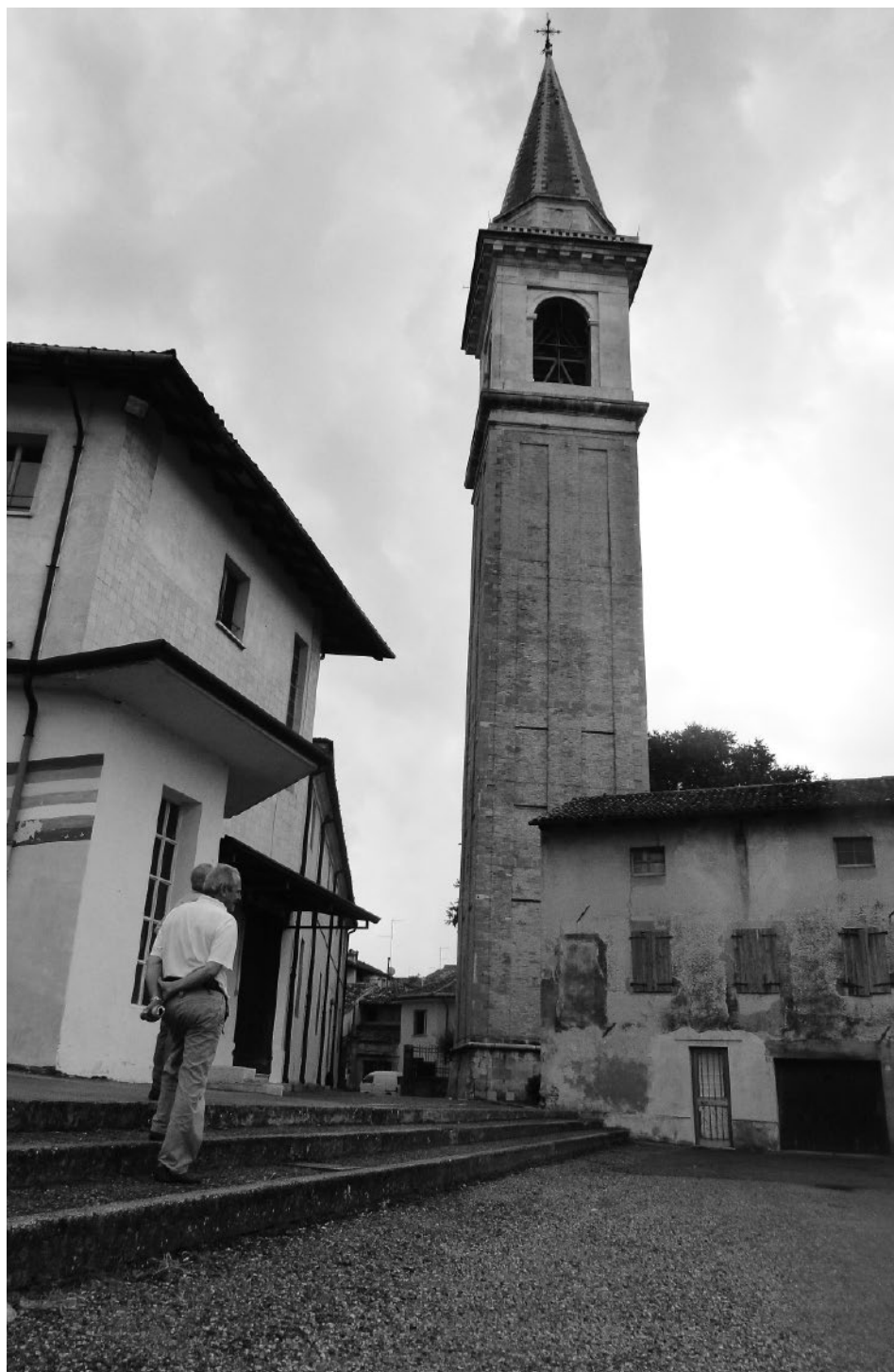
Slika 4: Zvonik v Codroipu 2011.