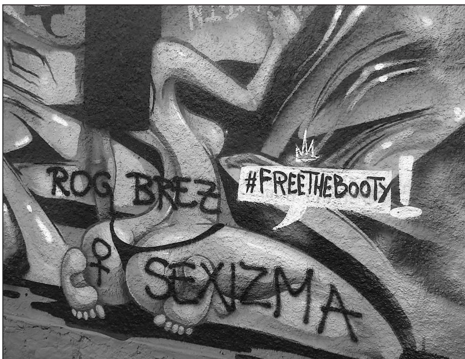
»Rog brez seksizma!« Grafit na zunanjem zidu Roga, Trubarjeva ulica, 1. 9. 2016.

»Ne, ena feministka, ki je na poti domov videla to estetiko šovinizma. Stekla je po sprej in pustila politično sled.« »Ja, pa saj grafit je že sam po sebi političen. Če si ga pa lahko nanj še kdo zdrka, pa toliko bolje. Tvoji grafiterki je samo dolgčas, ker je noben ne pofuka.« »Veš kaj, mojo grafiterko fukajo tako moški kot ženske in vsi drugi spoli, predvsem pa ona fuka njih, nadvse pošteno. In rada je zgoraj. Če še nisi opazil, si ti tudi spodaj, jaz pa na tebi. Jaz ne cenzuriram, jaz interveniram!«