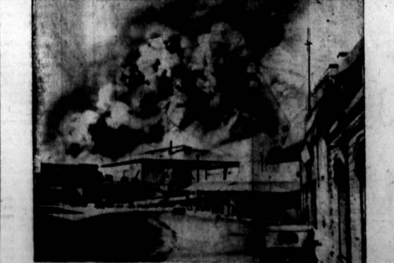
Škandilče lona v Haifi, Palestina, v plamenih. Ogenj so zanetili arabski rebeli.

(Iz Prosvete z dne 14. novembra 1918) Domače vesti. Prijavljenih je nadaljnjih pet imen rojakov, ki so umrli za špansko boleznijo. Delavske vesti. Vlada je pohvalila rudarje, da so dobro vršili svojo nalogo med vojno. Po svetovni vojni. Nova, demokratična nemška vlada apelira na Ameriko za življenje, kajti Nemčiji preti lakota. Nemški delegatje so se v Jokali, ko so izvedeli pogoje premirja. Nemčija mora dati zaveznikom poleg drugega vse vojne ladje, 5000 topov, 5000 lokomotiv in 50.000 železniških voz ter izprazniti ozemlje do Rene. Sovjetska Rusija. V Moskvi se je spet sezela kongres sovjetov z 800 delegati. Katarina Breškovska, znana kot "mati ruske revolucije," je pobegnila iz Rusije. (Dalje iz prve kolone.) malo — in bi se polagoma osamosvojil od kapitalistične politike. Z delavcem v mestih bi lahko kooperiral in obema bi bilo pomagano. Pa noče. Raje služi kapitalizmu za zavora predka. Najbrže bo opravljal to službo, dokler ne bo njegova vloga v družbi doigrana.