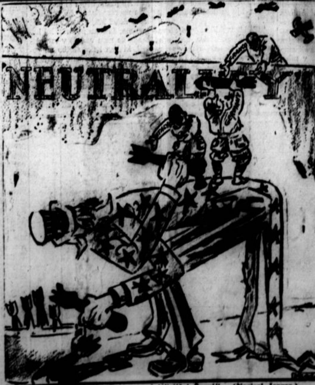
Ameriška "neutralski" napram lojalistični Španiji.

Veljavil veliko število drugih reform. Odpravil je arabako abecedo in uvedel latinsko. Iz Ankare, zapuščene vasice, je naredil moderno mesto in v to mesto se je preselila vlada, ko je postalo kapitol turške republike. V Parizu, Londonu, Berlinu in Rimu so videli v Atatürku despota, toda turško ljudstvo ga je ljubilo in mu zaupalo. L. 1923 ga je izvolilo za predsednika. Ponovno in brez opozicije je bil izvoljen za predsednika l. 1927, 1931 in 1935.