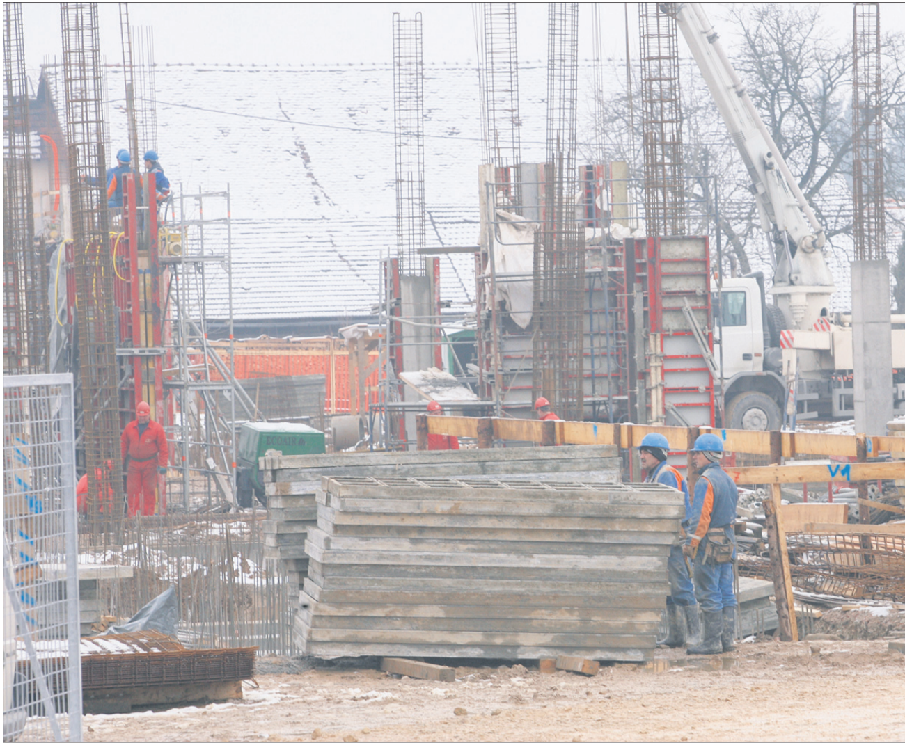
5,5 milijona evrov vredna gradnja griške šole je največji proračunski projekt Občine Žalec v letošnjem letu. Del na gradbišču se zlasti veselijo učenci in učitelji, ki se zdaj k pouku vozijo v prostore UPI Ljudske univerze Žalec.