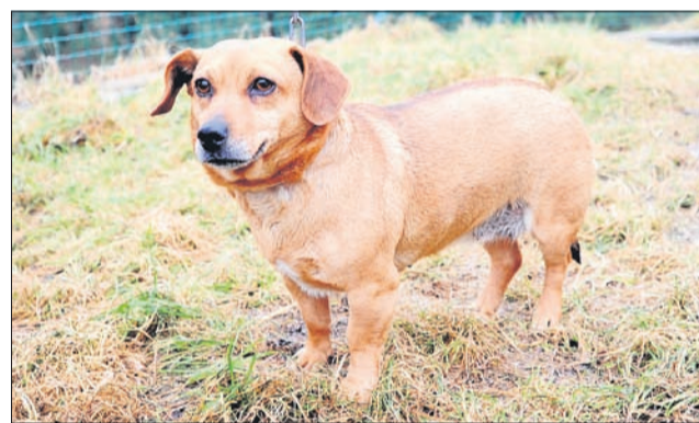
Laž ima kratke noge – tudi jaz sem na njih, čeprav ne lažem! (Tika)

DELOVNI ČAS pon. - pet. 7. - 19. ure sob. 7. - 12. ure ned. 7. - 8. ure dežurstvo 24 ur tel. 03/7493210 gsm 041-618-772 veterinarskabolnicašentjur www.vb-sentjur.si