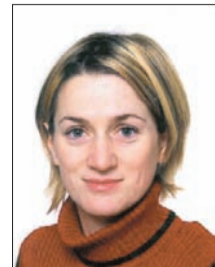
Piše: PAVLA KLÍNER

Kljub svoji nežnosti so zelišča lahko v veliko pomoč pri težavah, ki tarejo nežnejši spol - najsi bo najstnice, ženske pri tridesetih ali zrele ženske. Najboljše zaveznice ženskega zdravja so poleg prejšnji teden predstavljenih grozdnate svetlike, plahtice, črne mete in smetlike še rman, soja, šentjanževka, žajbelj, konopljika, poprova meta, črna detelja, kajenski poper, ingver in seveda kamilica.