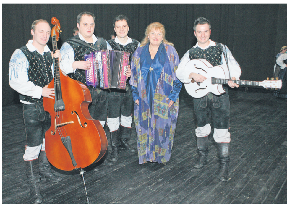
Vrhunec večera je bil prav gotovo nastop posebne gostje Elde Viler, ki je zapela skupaj z Modrijani. Darilo poslano od Boga, kot je rekla Elda, je bilo sodelovanje s temi odličnimi glasbeniki.