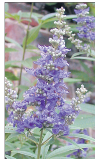
Konopljika pomaga zoper motnje menstrualnega ciklusa.

Rman ( Achillea millefolium ) je poleg kamilice najbolj cenjen zaveznik ženskega zdravja v našem ljudskem zdravilstvu. To prvovrstno zdravilo za vse ženske tegobe med drugim ureja premočno ali prešibko menstruacijo ter koristi za izpiranje pri belem toku in krčih maternice. Zunanje ga uporabimo za sedeče kopeli pri menstrualnih težavah, krvavitvah in krčevitih bolečinah psihovegetativnega izvora pri ženskah. Za sedežno kopel uporabimo