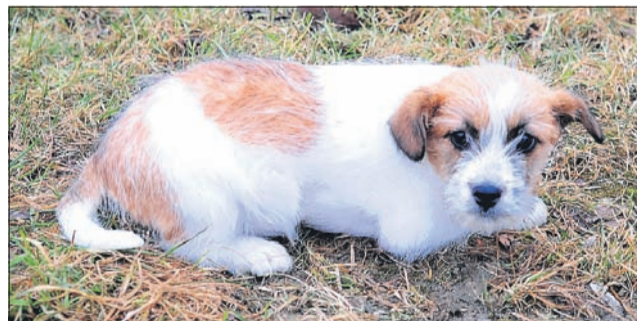
Sem plaha in mala Gaja – veselje imam rada!

DELOVNI ČAS pon. - pet. 7. - 19. ure sob. 7. - 12. ure ned. 7. - 8. ure dežurstvo 24 ur tel. 03/7493210 gsm 041-618-772 veterinarskabolnicašentjur www.vb-sentjur.si