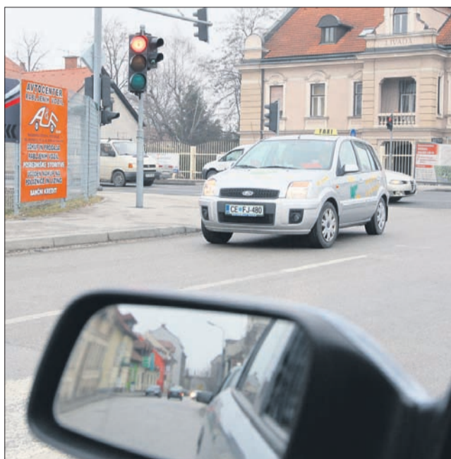
Slika je simbolična (Arhiv NT)