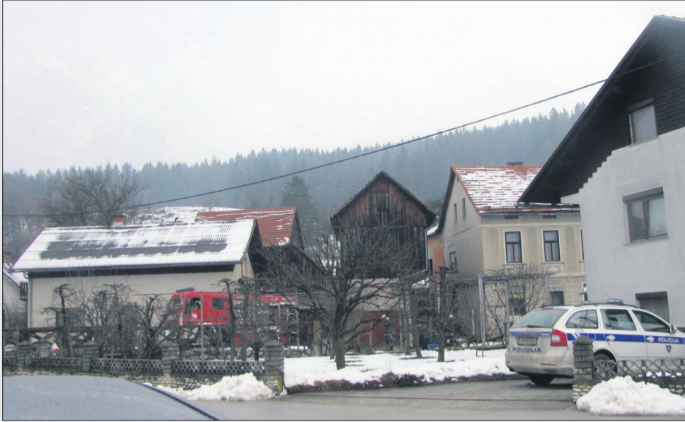
Prizorišče požara je bilo skrito pred radovednimi očmi.

15 tisoč evrov. Dogajanje ob božiču je še vedno, vsaj uradno, zavito v tančico skrivnosti. Mladenič naj bi se potem vrnil in pripovedoval različne zgodbe, kje je preživel dneve od četrтка, ko je izginil, do nedelje, ko se je pojavil doma. Kje je bil tiste dni, se uradno ni izvedelo, med ljudmi pa so krožile različne zgodbe, tudi ta, da naj bi s prijatelji slavil rojstni dan. Potem so domači-