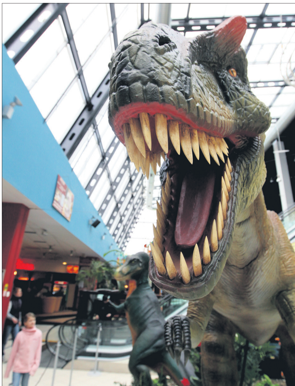
Dinozaver v Tušu