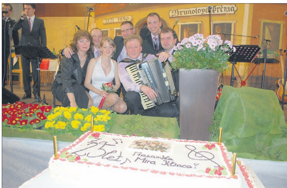
Slavljenci so ob zaključku koncerta dobili veliko torto.