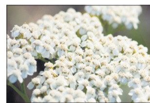
Rman pomaga proti belemu toku.

Čaj pripravimo kot poparek: dve žlički cvetov prelijemo s skodelico vrele vode, pokrijemo in po petih do desetih minutah precedimo. Spijemo tri do štiri skodelice čaja na dan.