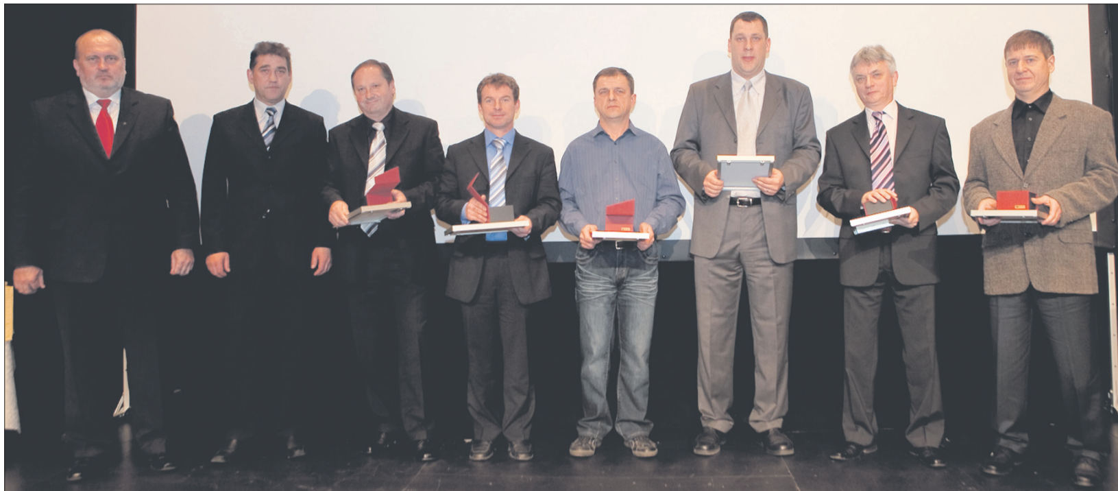
Skupinski posnetek najboljših inovatorjev v velenjskem premogovniku

VELENJE – V začetku lanskega leta se je v okviru Premogovnika Velenje in HTZ Velenje začela akcija Inovator leta kot eno motivacijskih orodij – z namenom spodbujanja kreativnosti pri vseh tistih, ki jim ni vseeno za aktivnosti v procesu. V akciji je sodelovalo 27 promotorjev in skoraj 100 inovatorjev, prevzetih oziroma v akcijo vključenih je bilo 190 koristnih predlogov.