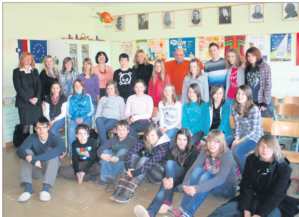
Kondi med žalskimi učenci