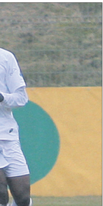
č pri CM Celju