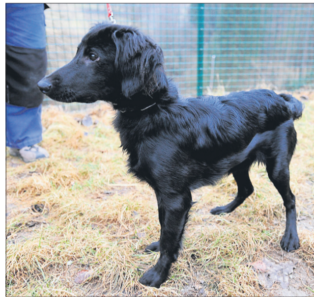
Poglej, poglej – a si tudi ti videl? (Paf)

Pred nabavo živali se je treba vprašati marsikaj. Ali doma že imamo kakšno žival? Kako se bosta novi in stari hišni ljubljencečka ujela? Mogoče v kratkem pričakujemo naraščaj v družini? Zelo pomembno je tudi, koliko prostora imamo v stanovanju ali na prostem. Na osnovi tega se odločimo, ali naj bo žival majhna ali velika. Prav tako, ali bo ljubljenceček pasemski, z rodovnikom, ali mogoče mešanec. Kakšen je njegov temperament in kako se ujema z otroki in drugimi živalmi, je naslednje zelo pogosto vprašanje. Kakšnega