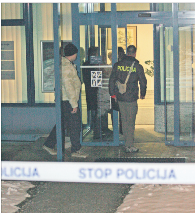
Preiskava je trajala več ur. Govorilo se je, da so neko žensko odpeljali v bolnišnico, vendar to naj ne bi bilo res.