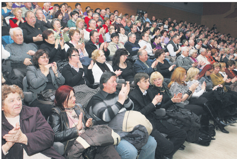
Dvorana Doma II. slovenskega tabora v Žalcu je bila razprodana.