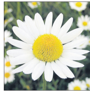
Nežna kamilica za nežnejši spol

Čaj pripravimo kot poparek: žličko ali dve posušenega rmanovega cveta poparimo s skodelico vrele vode, pustimo stati pet minut, precedimo in pijemo po požirkih dve do štiri skodelice čaja na dan.