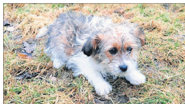
Prav lepo mi je – pridruži se mi! (Car)

Uradne ure zavetišča Zonzani: od ponedeljka do petka od 8. do 16. ure; ogledi psov: od ponedeljka do petka od 12. do 16. ure. Sprehajanja po dogovoru in predhodni najavi po telefonu, od ponedeljka do petka od 12. do 16. ure. Telefon: 03/749-06-00; internetni naslov www.zonzani.si