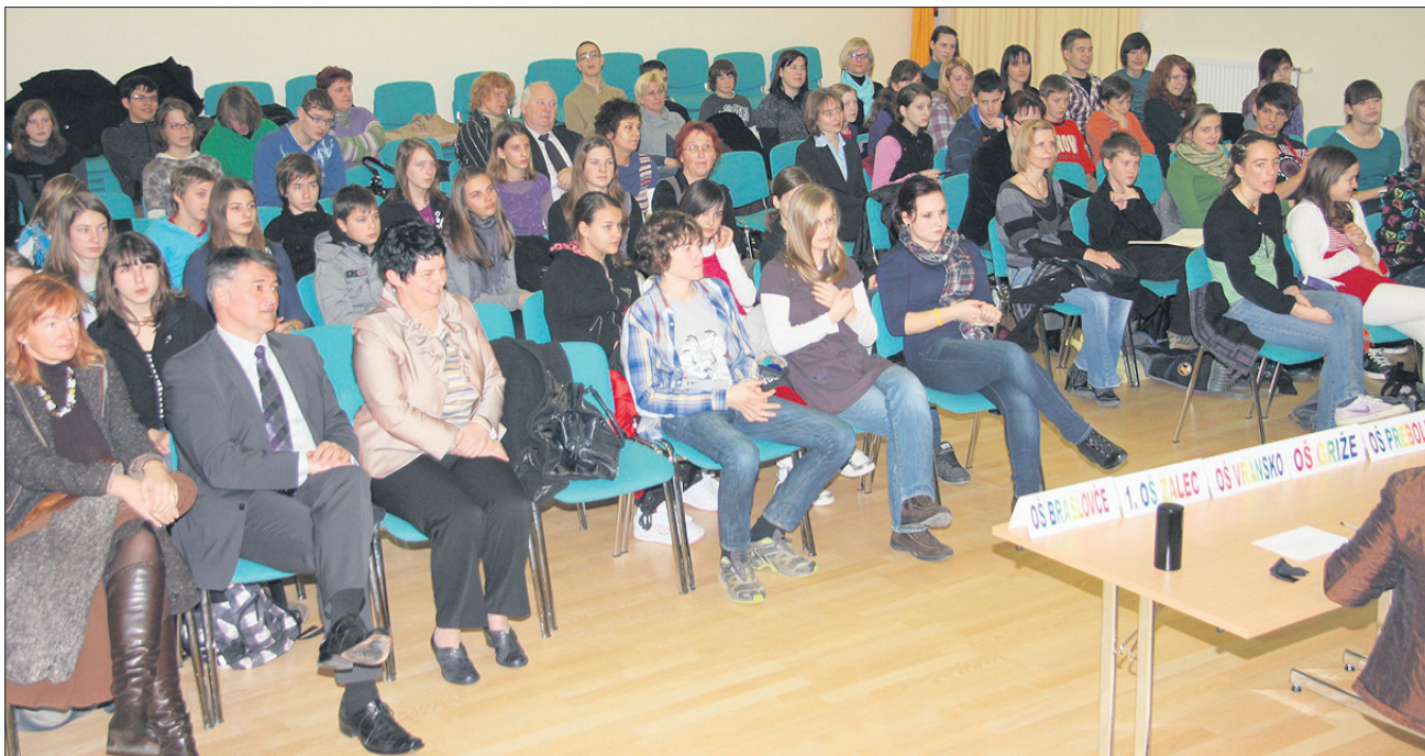
Medobčinski parlament v Žalcu