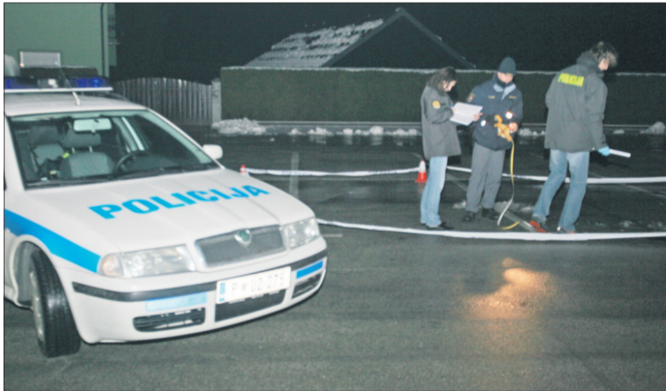
So roparji morda tukaj parkirali?

Četrtekovi roparji iz Šempetra še vedno neznanci – Na Celjskem se kopicijo neraziskani ropi. Četrtekovi roparji iz Šempetra še vedno neznanci – Na Celjskem se kopicijo neraziskani ropi. Četrtekovi roparji iz Šempetra še vedno neznanci – Na Celjskem se kopicijo neraziskani ropi. Četrtekovi roparji iz Šempetra še vedno neznanci – Na Celjskem se kopicijo neraziskani ropi.