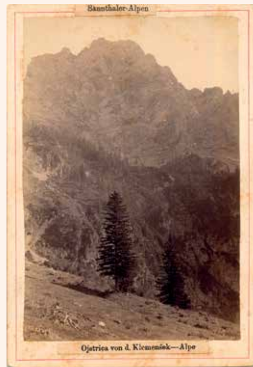
Ojstrica s Klemenškove planine.