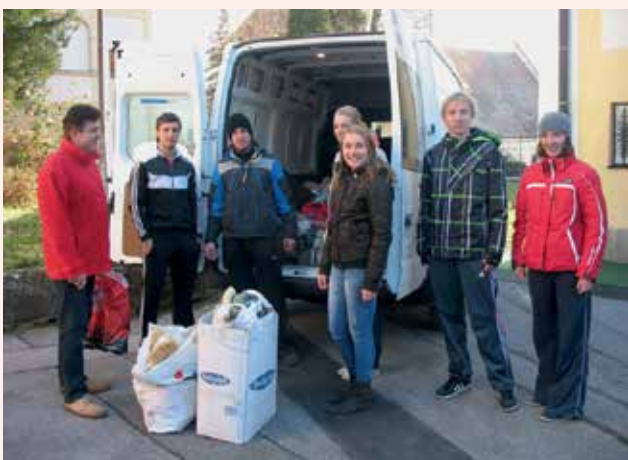
Od LAK-a smo prevzeli igrače in oblačila.

Preko 250 zbranih lepih igrač, nekatere od njih so bile celo nove, smo pri Območnem združenju RK Laško med drugimi namenili za akcijo »Laško združuje dobre želje«, zbrana sredstva dobrotelnega koncerta in drugih njihovih aktivnosti v višini 2.000 EUR pa smo po skupnem obisku vseh petih družin laške in radeške občine, ki imajo tudi dijake oz. študente, namenili zanje. Za vsako v višini 400 EUR, v obliki plačil stroškov. Z njihovo pomočjo smo njim in še komu zagotovo polepšali praznično vzdušje.