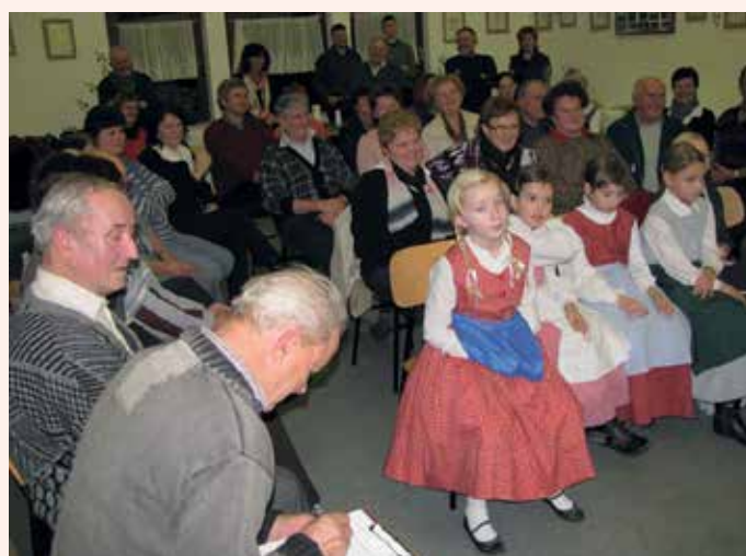
Na zaključnem srečanju v Šentrupertu je bilo še posebej veselo.