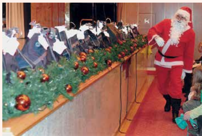
Dobri mož je tudi letos delil dobre želje in darila.

Člani organizacijskega odbora, nastopajoči in donatorji ste nas znova prepričali, da prireditev opravičuje svoj naslov in dober namen. Vsem res iskrena hvala.