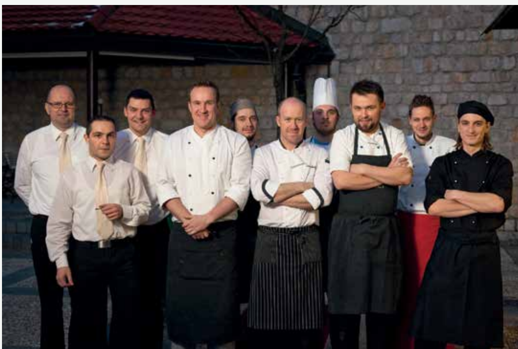
Ekipa gradu z gostujočimi kuharji na enem izmed kulinarčnih večerov.