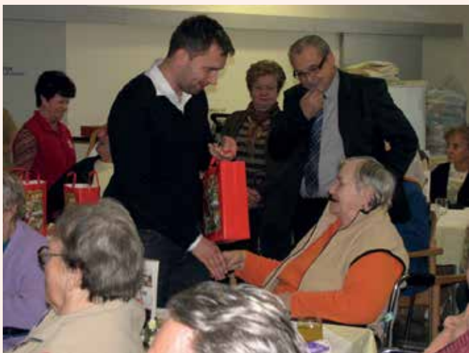
Skupni obisk varovancev v Loki je posebna prireditev samo zanje.

Poleg že omenjenih dveh domov so prostovoljci Rdečega križa obiskali še svoje krajanje v domovih v Hrastniku, Impoljci, Sevnici, Celju, Štorah, Vojniku, Šentjurju, Šmarju in drugod.