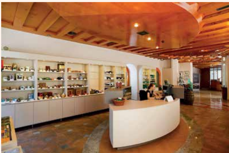
TIC Laško