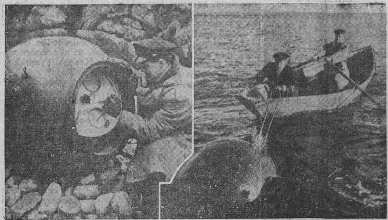
Na sliki vidimo kanadske mornarje, ki love po morju plavajoče mine, katere naredijo neškodljive. Na levi sliki odstranjuje neki mornar napravo, ki povzroči eksplozijo.

Zivljenje snežinke ni vedno enako. Včasih izgine, čim pade na zemljo, drugič zopet traja njeno življenje več dni ali pa celo vso zimo. V naših krajih je v začetku pomladi konec življenja vseh snežink. V polarnih krajih in na visokih gorah jim je pa usojeno mnogo daljše življenje. Tam se snežinke pod velikim pritiskom in vplivom dnevne toplote zgostijo naprej v zrnaste in pozneje v trdo ledeno obliko. Tako nastanejo ledeniki, ki preživijo pogosto cela desetletja ali celo stoletja. V njih je življenje snežinke najdaljše.