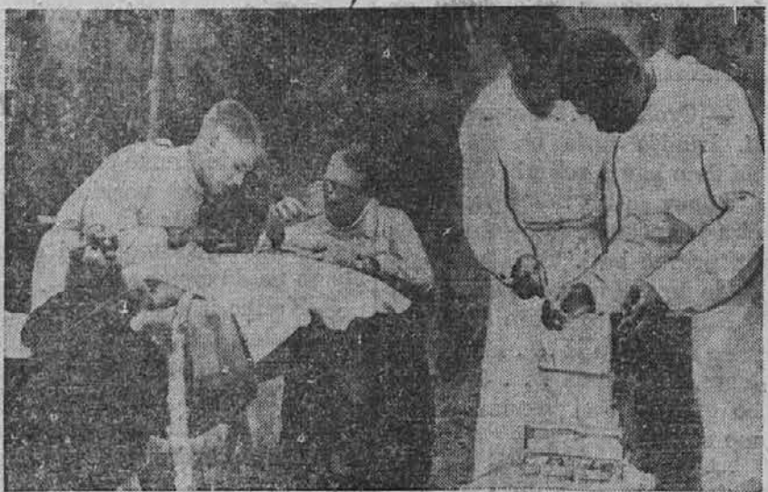
Na sliki vidimo vojaške zdravnike, ki operirajo tik za bojiščem v Severni Afriki nekega ranjenega vojaka.