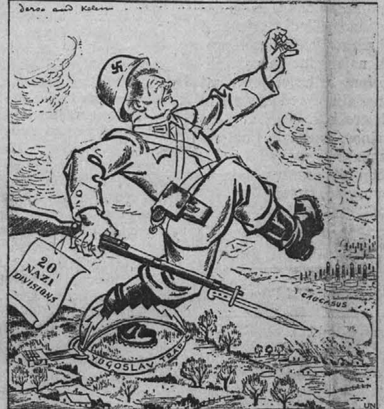
YUGOSLAV GUERRILLAS AID UNITED NATIONS