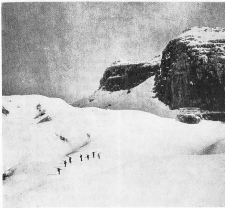
Gornja slika prikazuje spodnji del smučišč, po katerih teče proga »Kaninskega smuka«. Na desni je greben Konjca, ki je visok 2287 m