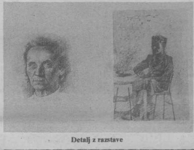
Detail iz razstave