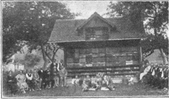
Čebelnjak g. F. Kranjca v Bočni.

Središka podružnica je imela svoj občni zbor 8. decembra 1931. Štela je 16 članov, ki so vsi redno plačali naročnino. Priredili smo tudi celodnevno tečaj. Dasi je bilo vreme izredno slabo, udeležba je bila vendarle lepa. Podružnica ima tudi Virijentovo stiskalnico za vosek, ki si jo je nabavila s podporo banske uprave. Ker vsakdo ve, kako je vosek dragocen pri naprednem čebelarstvu, zato je tudi dobra stiskalnica nadvse potrebna, da voščine popolnoma iztisnemo. Zahvaliti se moramo na tem mestu banski upravi za podporo, obenem pa našemu poštřtvovalnemu predsedniku, ki je dosti pripomogel, da smo jo dobili.