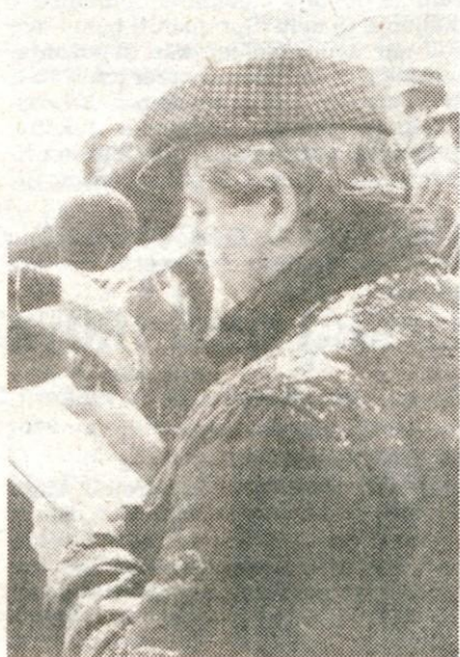
V snežnem metezu so v nedeljo potekale dražgoške prireditve. Na sliki od leve proti desni: pohodniki na cilju najtežjega pohoda od Pasje ravni do Dražgoš in slavnostni govornik Milan Kučan.

Milan Kučan je dejal, da je bila dražgoška bitka izraz vstaje slovenskega naroda, volja tega ljudstva pa je bila napisana v programu Osvobodilne fronte. Zato vstaja ni bila nikarkršna prevara, ampak boj zoper okupatorja in boj za boljše življenje, boj na strani naprednih sil v našem