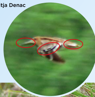
ČOKETA ( Gallinago media )