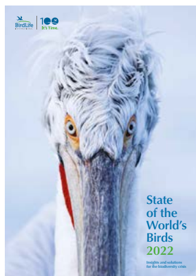
Poročilo Stanje ptic Sveta (State of the World's Birds) vir: BirdLife International

BirdLife International je izdal peto številko poročila Stanje sveta ptic (State of the World's Birds), ki prikazuje najbolj zaskrbljujoče stanje naravnega sveta doslej. Publikacija navaja ugotovitve, ki še dodatno potrjujejo razsežnosti in posledice biodiverzitetne krize, hkrati pa prikazuje rešitve, ki jih nujno potrebujemo za reševanje narave in posledično nas samih.