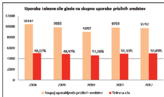
Slika 3: Uporaba telesne sile glede na skupno uporabo prisilnih sredstev ("Policijska pooblastila – statistika", 2013).

Slika 3 prikazuje pogostost uporabe telesne sile v primerjavi s pogostostjo uporabe drugih prisilnih sredstev v obdobju med 2008 in 2012. Od vseh uporabljenih prisilnih sredstev predstavlja uporaba telesne sile približno polovični delež. Iz tega lahko sklepamo, da policisti za reševanje konfliktnih situacij zelo pogosto uporabljajo telesno silo, kar je skladno z načelom postopnosti – od najmildjšega proti najhujšemu prisilnemu sredstvu ("Policijska pooblastila – statistika", 2013).