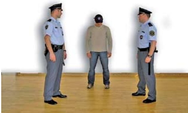
Slika 2: Policijski trikotnik (Nemanič, 2007).

ki so povzeti iz karateja (Nemanič, 2007): osnovni, sonožni položaj ( Heiko dachi ), sprednji položaj ( Zenkutsu dachi ), zadnji položaj ( Kokutsu dachi ), srednji – jahalni položaj ( Kiba dachi ), univerzalni – borbeni položaj ( Fudo dachi ). Vsi postopki večinoma potekajo v tako imenovanem policijskem trikotniku. V tem položaju policist stoji polbočno pred napadalcem, na razdalji, ki je nekoliko večja od dolžine iztegnjene roke. Policijski trikotnik je prikazan na Sliki 2. Omenjeni položaj v primeru napada omogoča takojšen umik nazaj, vstran ali odskok.