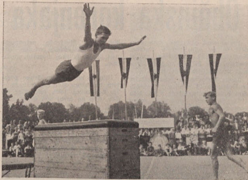
Na sliki vidimo prizor s telovadnega nastopa v športnem parku na Kodeljevem. Nastop je bil v okviru tedna športnih prireditev naše občine.