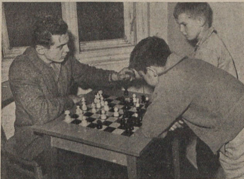
Za šahovsko mizo se »udarijo« med seboj starejši in pa tudi najmlajši pristaši te igre