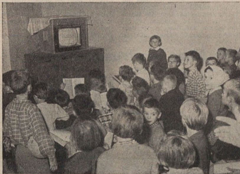
Televizijski aparat je največji magnet za mlade obiskovalce

premalo je tistih, ki bi delo prevzeli. Le široka delavnost in prizadevanje vsega članstva, zlasti pa odbornikov, bo pripomoglo k uresničevanju načrtov.