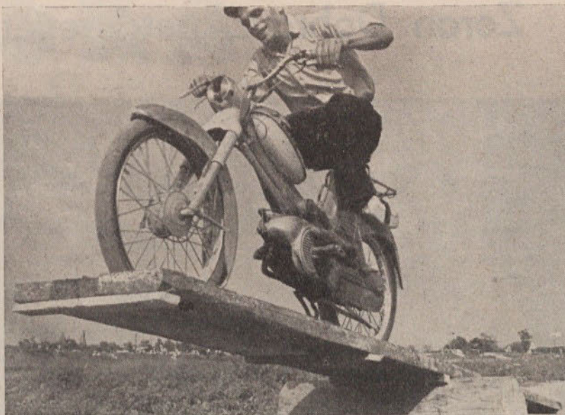
Vožnja preko tehtnice