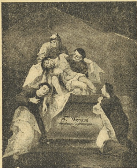
Fortunat Bergant: Jezusa polagajo v grob. XIV. postaja križevega pota v samostanski cerkvi v Stični (iz leta 1766)

da zločine komunizma samo obsojamo. Moramo tudi moliti, da Bog prekriža načrte vseh, ki bi radi upostavili na vsej zemeljski obli enakost v bedi, ponižanju in suženjstvu vsemogočni državi.