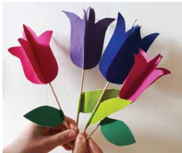
Šopek za mamo

Najpomembnejše ta hip je, da ohranimo zdravje, da si čas zapolnimo z delom, v katerega moramo vložiti določen trud, da smo lahko ponosni nase in se veselimo dosežkov. Zato je nujno tudi sedaj otroke usmerjati v gibanje in proč od ekranov, kolikor je le možno. Tudi tovrstnih idej obstaja ogromno, zlasti po zaslugi naših domiselno iznajdljivih športnih učiteljev.