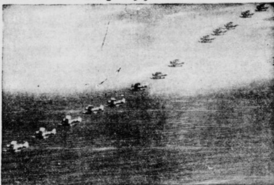
Cele eskadre letal tipa »Curtiss« so se te dni napotile čez Atlantski ocean v Evropo na pomoč zaveznikijskim vojskam