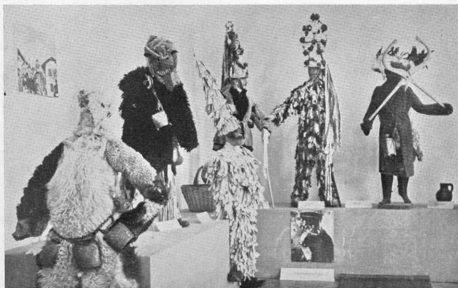
Z razstave slovenskih ljudskih mask v Slovenskem etnografskem muzeju od aprila do decembra 1963

Zgoraj: dobrepoljska mačkara (Dolenjska) — Ta bršljanast, Cerčno (Primorska); spodaj: Soura (Tolmin), Pust (Drežnica), Ta cunjast (Kubed), trije Skoromati (Brkini)