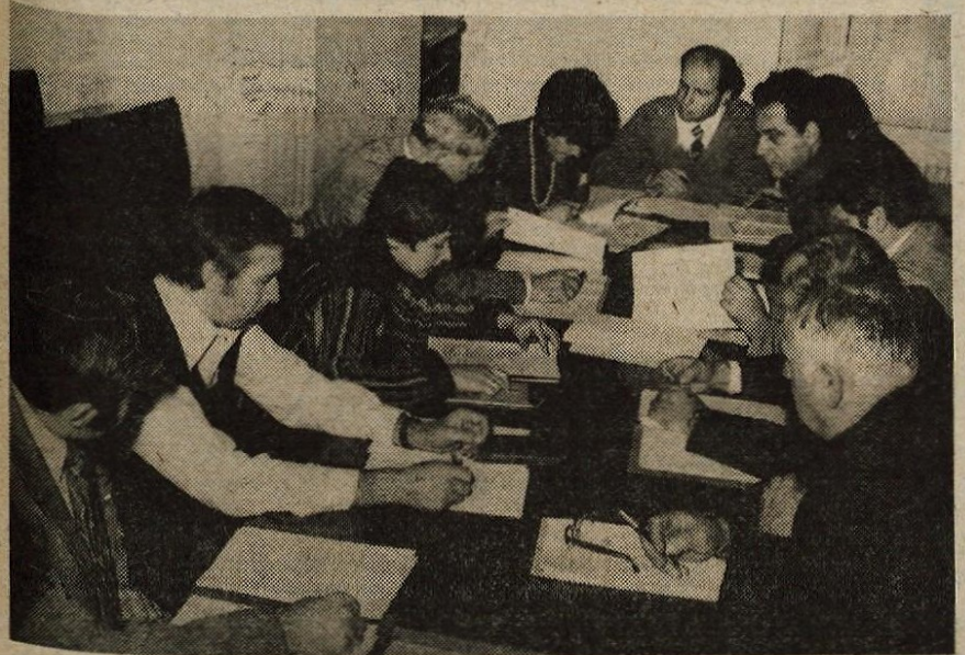
Škofja Loka - V sredo, 17. novembra, so se člani sveta INDOK centra pogovorili o programu dela, o predlogu finančnega načrta ter o sodelovanju s časopisnim podjetjem Glas.

GLASILO SOCIALISTIČNE ZVEZE DELOVNEGA LJUDSTVA ZA GORENJSKO