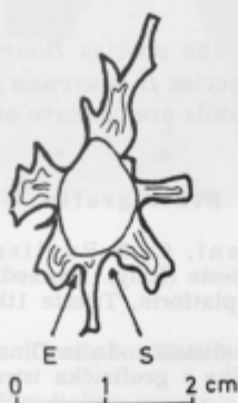
Fig. 2. Biradiolites zucchii n. sp., sezione trasversale in cui si evidenziano le aree sifonali

In tutti gli individui le valve destre presentano lunghe e robuste coste alcune visibilmente ramificate. Si notano 2 coste maggiormente sviluppate e ramificate lunghe 20 e 16 mm, nell'olotipo, 25 e 19 mm. in corrispondenza di una sezione più vicina alla linea di commessura, tav. 1 fig. 1. Le aree sifonali fig. 2 sono insellate tra due grosse coste a forma di spatola e divise da una costa lunga, leggermente ramificata, quella corrispondente alla vicina area sifonale E è corta ed ampia, quella in corrispondenza della area sifonale S è più lunga e meno ampia dell'altra. Ambedue mettono in risalto una struttura finemente lamellare con concavità rivolte verso il