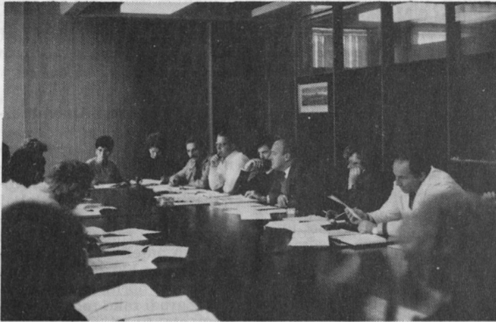
Razprave o predlogu sporazuma.

na upoštevanju rezultatov preteklega obdobja in na primerjavi z ostalimi udeleženci sporazuma (čevljarsko-predelovalno industrijo SR Slovenije).