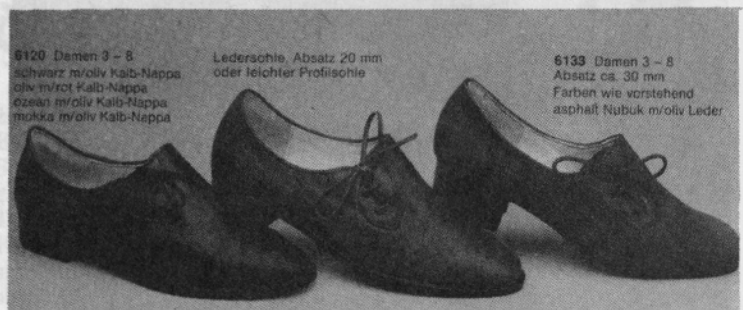
6120 Damen 9 - 8 schwarz m/oliv Kalb-Nappa oliv m/rot Kalb-Nappa ocean m/oliv Kalb-Nappa mokka m/oliv Kalb-Nappa

Kljub končani javni razpravi smo napisali, katera področja obsega sporazum ki ga bomo morali upoštevati, ko bo sprejet, v posameznih členih pa bomo morali tudi spremeniti in dopolniti obstoječe pravilnike, predvsem pravilnike o osnovah in merilih o razporejanju čistega dohodka in delitvi sredstev za osebne dohodke. iz pravnega oddelka