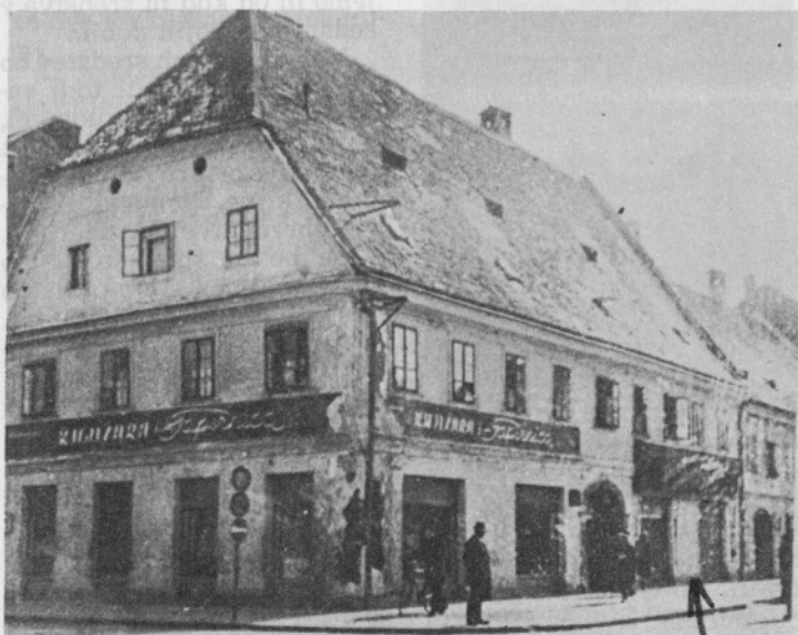
Zgradba, v kateri je bila prodajalna od leta 1930 do 1941 in 1948 do 1949 (lastnik zgradbe trgovec Purebl)