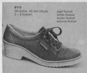
6113 TR-Sohle, 40 mm Absatz 3 - 8 Damen

Če bo to sprejeto, bomo poskrbeli za čimprejšnjo realizacijo, seveda v fazah. Najti bomo morali premostitvene vire, da bi pospešili realizacijo.