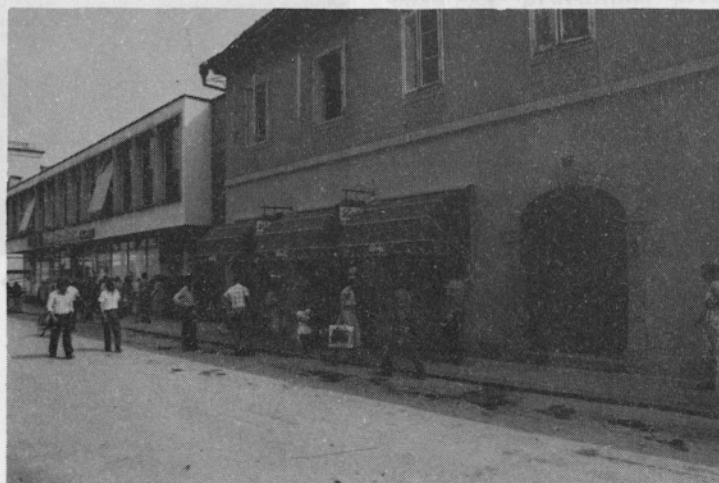
Poslovalnica »PEKO« Karlovac danes.