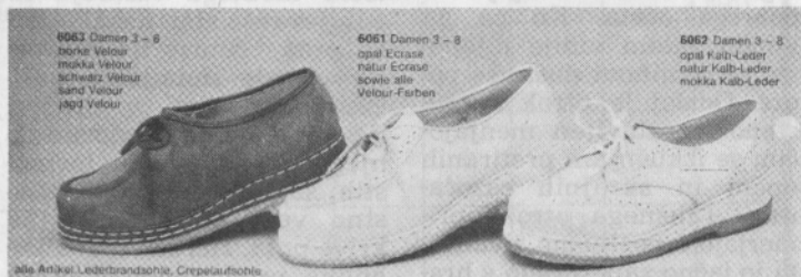
6063 Damen 3 - 6 moška Velour moška Velour schwarz Velour sand Velour jagd Velour