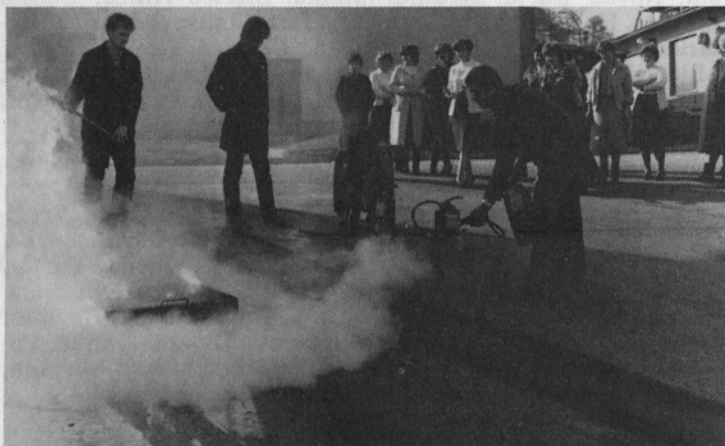
Praktični prikaz gašenja.