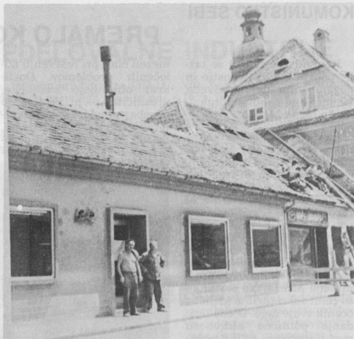
Stara stavba v Radičevi ulici, ki se je morala umakniti sodobni trgovski hiši