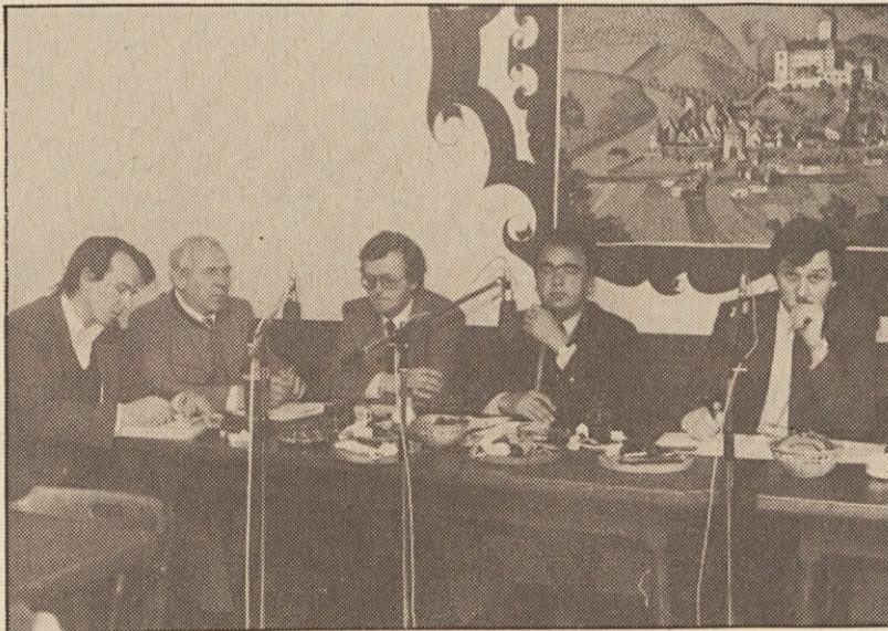
Pliberčani so diskutirali o svojih gospodarskih problemih

Podžupan OSCHMAUTZ hoče, da je samo avstrijska vlada in nobeden drugi dolžan, da skrbi za delovna mesta v naših krajih. To pove seveda samo zato, ker namigava na delovna mesta mešanih firm, ki mu niso po volji. Na Pecí naj bi ka sami