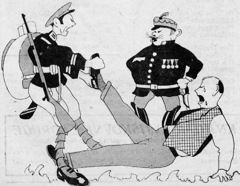
Japonsko „prostovoljno“ notranje posojilo

Miha: »Prijatelj, zakaj se razburjaš? Od našega stoletja je preteklo komaj 38 let; bog ve, kaj se še vse lahko zgodi v pri- hodnjih 62 letih.«