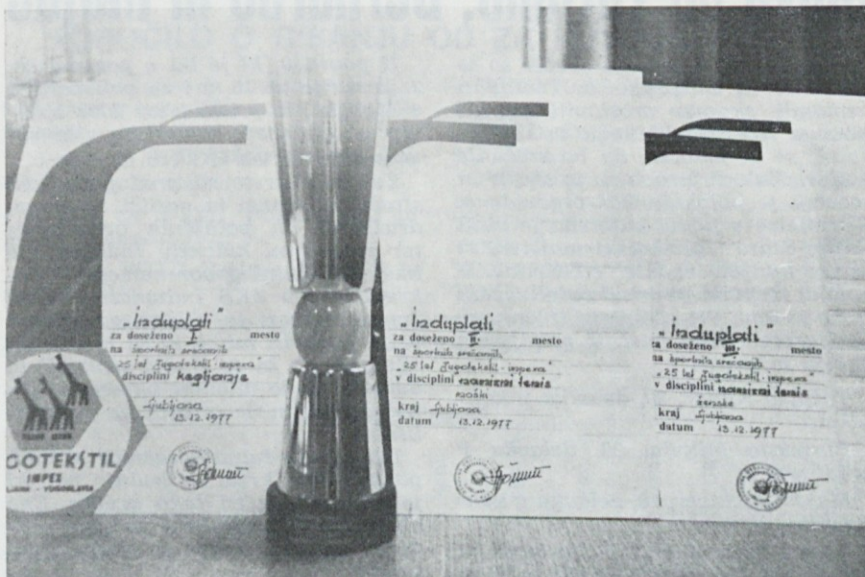
Priznanja športni ekipi Induplati za osvojitve enega I., enega II. in enega III. mesta, kar je doprineslo I. mesto v skupnem plasmanu na športnem srečanju ob 25-letnici Jugotekstila