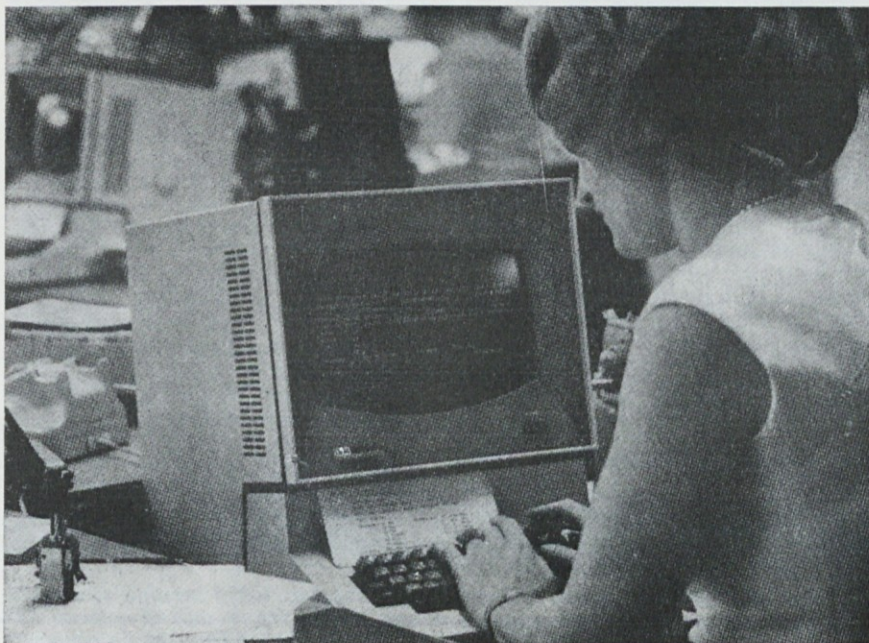
Uporabnik neposredno komunicira z računalnikom

Danes lahko ugotovimo, da smo si v teh letih ustvarili obsežno banko podatkov, saj npr. v tzv. proizvodno-komercialno-računovodski aplikaciji vodimo zaloge skoraj vseh skladišč, obdelujemo saldakonte kupcev in dobaviteljev, podatke o sestavi in delovnih operacijah za velik del naših izdelkov itd. Obračunu osebnih dohodkov pa smo že pred leti priključili kadrovske evidenco, katalog delovnih mest oz. nalog, obračun potrošniških posojil in prispevkov in drugo, tako da sama plačilna vrečka