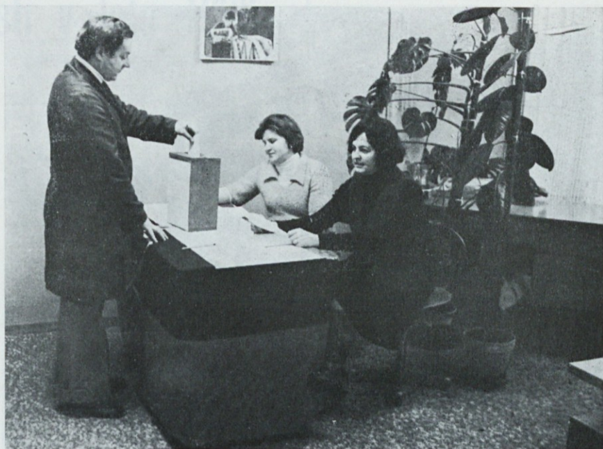
Referendum v Konfekciji