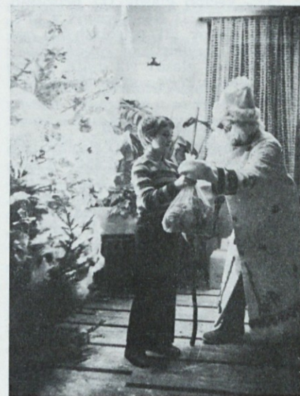
Dobri dedek Mraz je imel skromna darila le za otroke OOS Konfekcija in OOS Restavracija