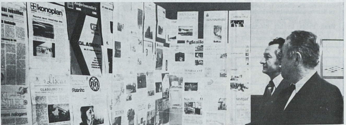
Ugledna gosta si ogledujeta razstavljeni glasila OZD

Izdaja v 1000 izvodih DO INDUPLATI Jarše n. sol. sub. o. Uredniški odbor: Marija JEREB, Vida KOŽELJ, Cilka MRĐENOVIC, Ingo PAŠ, Janko UKMAR, Lado ZABUKOVEC in Ivana SEIFERT — odgovorni urednik. Natisnila tiskarna Učnih delavnic v Ljubljani. Konoplan je oproščen plačila prometnega davka z odločbo Sekretariata za informacije SRS (421-1/72 od 8. aprila 1974)