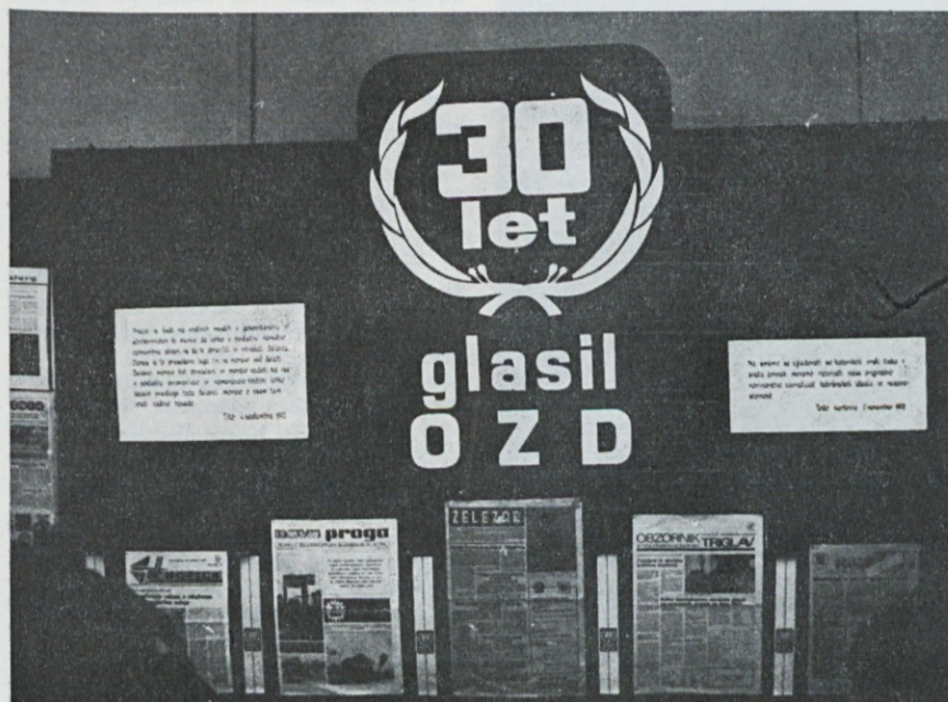
Pet nagrajenih glasil: PTT NOVICE, NOVA PROGA, ZELEZAR, OBZORNIK TRIGLAV in HMEZAD