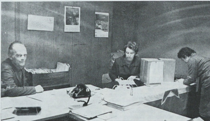
Referendum v Tkalnici

Pravilniki so bili na referendumu sprejeti: v TOZD Proizvodnja z 61 %