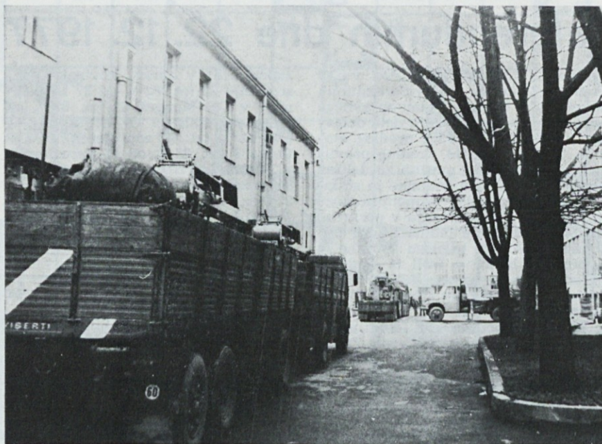
Tovornjak z brezčolničnimi stroji na dvorišču tovarne