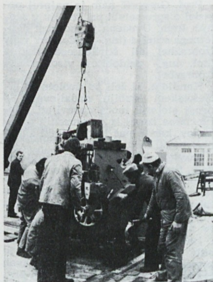
Novi stroj pripenjajo na dvigalo, ki ga bo dvignilo v zadnje nadstropje Konfekcije