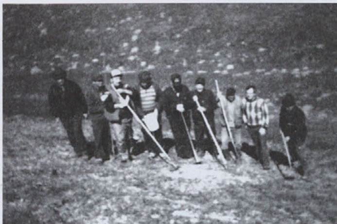
Odstranili bomo, kar so drugi odvrgli v naravi!

Da smo lovci vedno bolj tudi naravovarstveniki, dokazujemo z vsakoletnimi akcijami čiščenja odpadkov, ki jih za sabo po gozdovih in poljih puščajo neosveščeni občani in ostali slučajni obiskovalci - pohodniki, gobarji in drugi. Očitno se marsikdo ne zaveda dolgoročnih posledic takega brezobzirnega ravnanja.