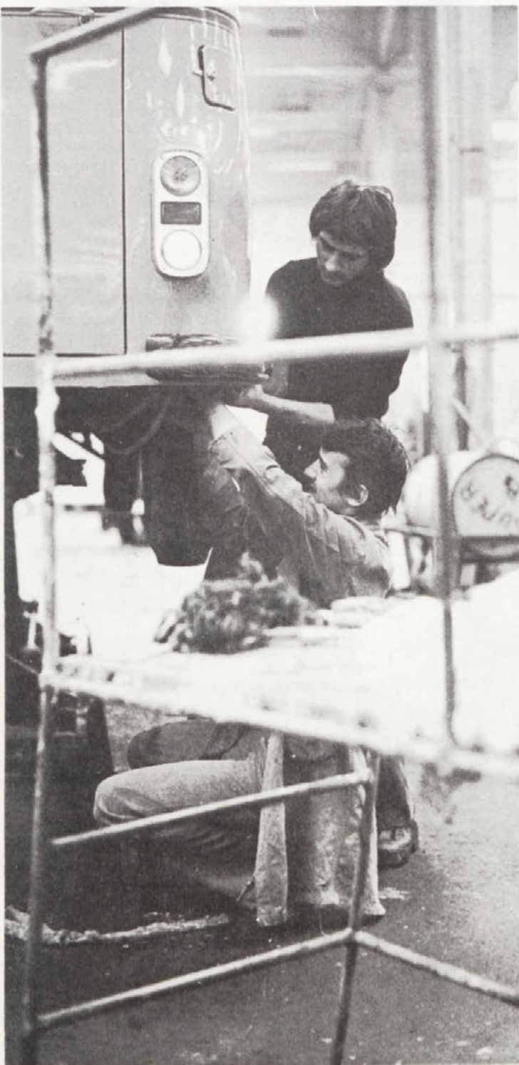
Zanimanje za naša gospodarska vozila narašča iz dneva v dan.