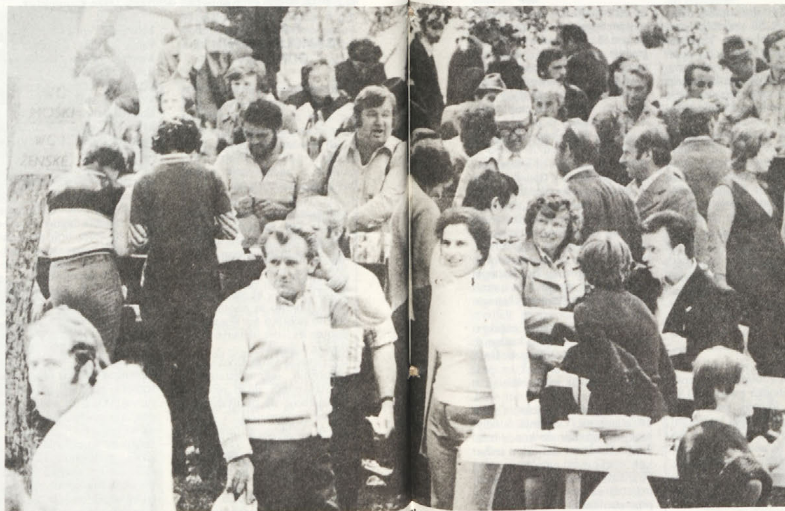
In še ena fotografija s srečanja na Gorjancih, ki jo da spomini nanj ne bodo prehitro zbledeli.

Težave smo imeli pri načrtovanju in prevozu z avtobusi. Naš vozni park je bil nezadosten, da bi lahko pripeljal na Gorjance vse, ki so se prijavili. Za prevoz z avtobusi je bilo prijavljenih 2413 delavcev in 1731 članov njihovih družin. Zaradi tolikšnega števila potnikov so TOZD Tovarna opreme Mirna, Črnomelj in Brežice posebno naročile avtobuse in organizirale lasten prevoz, ostalo število prijavljenih pa naj bi