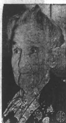
Mrs. Martha Truman, mati našega predsednika Trumana, ki je stara že 94 let in je bila zadnje čase v precej slabem položaju, da je bilo pričakovati smrti vsak čas, je zopet na potu okrevanja. Mrs. Truman bolega na oslabelosti in utrujenosti srca.

DAJ BRAT, DAJ SESTRA, SPOMNI SE BEGUNCEV S KAKIM DOLARJEM