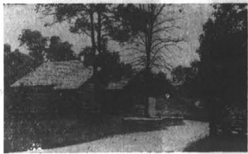
Zaleski State Forest, Old Man's Cave on right.

One of Ohio's newest and in many respects, most complete, State Forest Park centers about the jewel-like Lake Hope in the 22,000-acre Zaleski State Forest in Vinton County, 25 miles south of Logan.