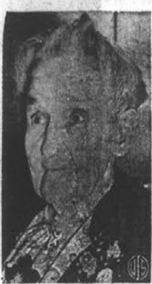
Mrs. Martha Truman, mati našega predsednika Trumanana, ki je stara že 94 let in je bila zadnje čase v precej slabem položaju, da je bilo pričakovati smrti vsak čas, je zopet na potu okrevanja. Mrs. Truman boleha na oslabelosti in utrujenosti srca.

DAJ BRAT, DAJ SESTRA, SPOMNI SE BEGUNCEV S KAKIM DOLARJEM