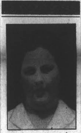
V BLAG SPOMIN OSME OBLETNICE ODKAR NAS JE ZA VEDNO ZAPUSTILA NAŠA LJUBLJENA IN NIKDAR POZABLJENA SOPROGA IN MATT