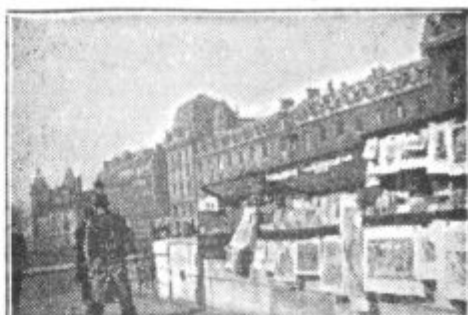
Prodajalna starih knjig. V ozadju policijska prefektura in pravosodna palača (na levi)

Prvi bukinisti so se pojavili l. 1614. Poseben privilegij so dobili 20. jan. 1629. Pri mostu St. Michel, v študentskem kvartu, so prodajali študentom knjige. Od takrat pa do danes