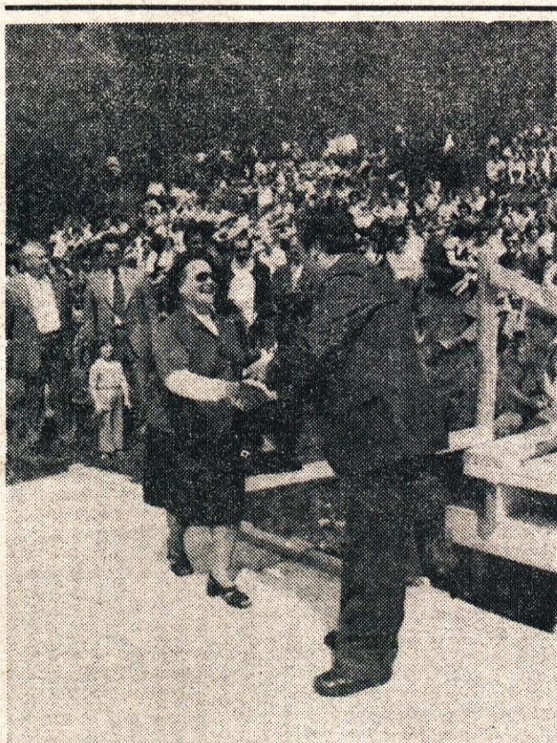
S piknika v Kamniški Bistrici