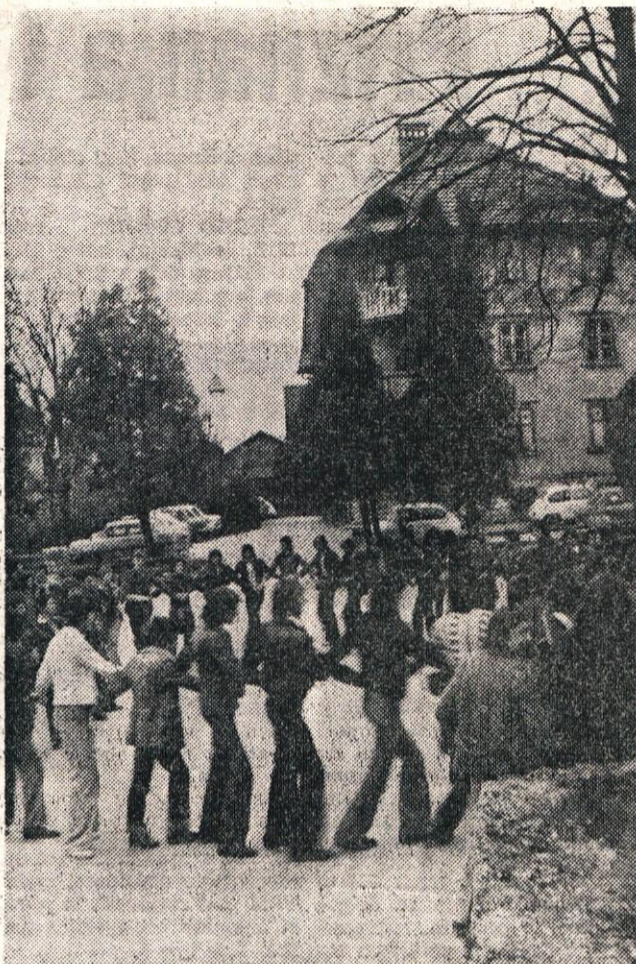
Titovo kolo jih je povežalo