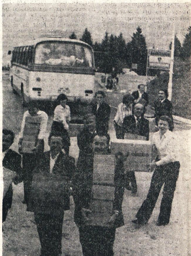
Solidarci so morali knjige prinesiti nazaj v Jugoslavijo