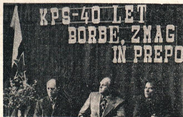
Slavnostnega sestanka v Kemijski industriji Kamnik

Vsi prisotni so sklenili, da bodo tovarišu Titu in CK ZKS z zborovanja poslali pozdravni pismi, ki sta jih prebrala člana osnovne organizacije ZSMS.